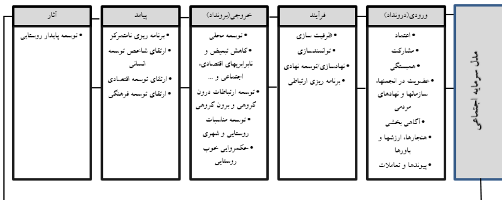
شکل شماره (۲): الگوی سرمایه اجتماعی برای توسعه روستایی براساس رویکرد سیستمی، منبع: (افتخاری و همکاران، ۱۳۹۴)

امروزه الگوهای نظری بسیاری توسط محققین مختلف برای تعیین ارتباط سرمایه اجتماعی و مباحث توسعه روستایی مطرح شده است. افتخاری و همکاران (۱۳۹۴) در پژوهش خود براساس رویکرد سیستمی یک الگوی نظری سرمایه اجتماعی برای توسعه روستایی معرفی نموده اند. در این الگو در قالب رویکرد سیستمی ویژگیهای سرمایه اجتماعی را داده (درون داد)، فرآیند، خروجی (ستاده) پیامد و اثر ذکر و تشریح نموده است. شکل (۲) این الگو را نشان می دهد.