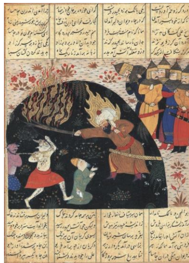
تصویر ۲. نبرد حضرت امیر با موجودات افسانه‌ای. فرهاد شیرازی. خاوران نامه شیراز. تهران. ۸۸۲-۸۹۲ ه.ق. موزه کاخ گلستان. (رجبی، ۱۳۹۰: ۸۰)

قراقویونلوها، سلسله‌ای شیعی بودند و خاوران نامه تحت حمایت پیروان پسر جهان‌شاه که در اواخر سده ی نهم هجری در شیراز حاکم بود، مصور گشت و احتمالاً مصورسازی این نسخه ی خطی شیعی، تحت سرپرستی خلیل، پسر اوزون حسن (رهبر آق‌قویونلو) و توسط همان هنرمندانی که بعد از مرگ پیروان در شیراز باقی ماندند، ادامه یافت. اگر چه در دوران حکومت خلیل، تسنن مذهب رسمی بود، نگاره‌های خاوران نامه نشان می‌دهند که هنرمندان و حامیان آن به امام علی(ع) می‌گذاشتند. می‌توان چنین فرض کرد که حکمرانان ترکمن همان سیاست تیموریان را در احترام به شیعه و مفاهیم آن پی گرفتند. (شایسته‌فر، ۱۳۸۴: ۸۷)