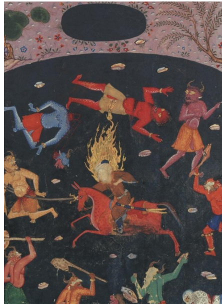
تصویر ۴. مسخر نمودن اجنه توسط امیرالمومنین علی (ع). هنرمند نامعلوم. احسن الکبار. ۹۸۸ ه.ق. کاخ گلستان. (رجبی، ۱۳۹۰: ۲۲۰) حبیب‌السیر، تألیف ارزشمنند خواند میر، در ذکر احوال انبیا (ع) و بیان حالات حکما نوشته شده است. جزء چهارم در ذکر وقایع ایام خلافت حضرت علی (ع) است. (شاهکارهای نگارگری ایران، ۱۳۹۰: ۱۷۹)