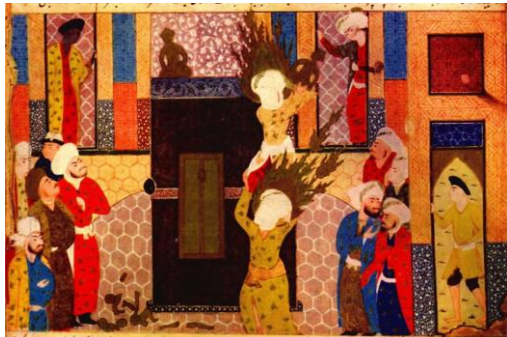
تصویر ۶. علی بر شانه‌های پیامبر بت‌ها را از قسمت بالای کعبه می‌اندازد. میرخواند. روضه‌الصفاء. مصر. موزه قاهره. (شایسته‌فر، ۱۳۸۴: ص ۱۵۴)

کتاب روضه‌الصفاء اثر مولانا حسین کمال الدین حسین بن علی معروف به واعظ کاشفی نویسنده و واعظ فارسی است که به دستور و درخواست شاهزاده مرشد الدین عبدالله ملقب به سید میرزاداماد سلطان حسین بایقرا در سال (۹۰۸-۹۰۹) نوشته شده است. این اثر زندگی نامه‌ی شهیدایی چون علی (ع) و خاندانش به ویژه امام حسین است که در مکتب باشکوه بغداد به وجود آمده است. این کتاب بین شیعیان معروف و شناخته شده است و به عنوان یادبودی از محرم استفاده می‌شود؛ همچنین اثری ماندگار از خود در مراسم عزاداری که روضه خوانده می‌شود به جا گذاشته است. (شایسته‌فر، ۱۳۸۸: ۱۸)