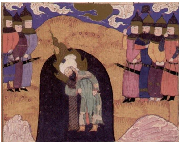
تصویر ۳. حضرت علی ستون سلیمان را از جا برمی‌کند. فرهاد شیرازی. خاوران نامه شیراز. تهران. موزه کاخ گلستان. (خوسفی بیرجندی، ۱۳۸۱: ۶۵)

کتاب احسن الکبار فی معرفه الائمه الاطهار تألیف ابن عرب‌شاه محمدبن ابی زیدالعلوی ورامینی از علمای شیعه به سال ۸۲۷ ه.ق است. این اثر نخستین تألیف به زبان فارسی، پیرامون زندگی امامان شیعه به شمار می‌آید. این کتاب در سده ی ۱۰ هجری، به روزگار شاه طهماسب اول صفوی و به دستور او به دست فخرالدین علی ابن حسن زواری تلخیص شده و با افزودن مطالبی بر آن به نام لوامع الانوار الی معرفه الائمه اطهار نامیده شده است. این نسخه با ۱۷ مجلس از رویدادهای مهم زندگانی و معجزات پیامبر و ائمه اطهار آراسته شده است. (شاهکارهای نگارگری ایران، ۱۳۹۰: ۲۱۳) این تصاویر وقایعی را روایت می‌کنند که در اسلام و نزد شیعه از اهمیت بالایی برخوردارند و شیعه بدانها می‌بالد. برخی از وقایع نیز صفات و فضائل ائمه را به نمایش می‌گذارند. تصویر زیر نبرد حضرت علی با نره دیوان را در چاه پیرالعلم، که به اذن رسول انجام شد نشان می‌دهد. بنابر مندرجات مربوط به این تصویر در احسن الکبار که از ابوبکر مفسر شیرازی نقل قول می‌کنند، رسول اکرم (ص) در روز حدیبیه از عمر، عثمان و