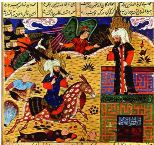
تصویر ۱: جبریل قدرت فوق‌العاده علی را به پیامبر اکرم نشان می‌دهد. از ابن حسام. خاوران نامه شیراز. تهران. ۸۸۲-۸۹۲ ه.ق. موزه کاخ گلستان. (شایسته فر، ۱۳۸۴: ۸۸)

پیامبر(ص) قرار می‌دهد. برای نشان دادن شجاعت علی(ع) در نسخ خطی کلیات تاریخی و خاوران نامه، هنرمندان و حامیان سعی کردند داستان‌هایی را انتخاب کنند که توانایی ویژه ی علی(ع) را نشان دهد. (شایسته‌فر، ۱۳۸۴: ۱۶-۷۷)