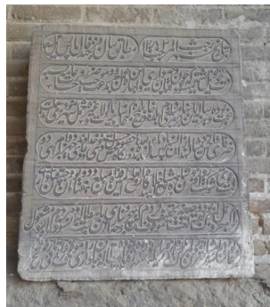
شکل ۲- کتیبه ای واقع در دالان میانی سرای گمرک مربوط به رجب ۱۲۸۳ ه.ق در زمان سلطنت ناصرالدین شاه قاجار

مالیات گمرک در دوره زندیه توسط کلانتر بررسی و اخذ می‌شد که در دفتری به نام گمرک در کاروان‌سرای گمرک حضور داشت؛ کلانتر که انتظامات شهر به عهده او بود شخصا میزان حق گمرک را تعیین می‌کرد اما این نوع تعیین مالیات سبب سو استفاده می‌شد که حتی گاهی حق گمرک به قدری زیاد محاسبه می‌شد که واردات اجناس برای تاجر سودی نداشت (فرانکلین، ۱۳۵۸: ۴۵). بنابراین در ابتدای دوره قاجار شیوه اخذ مالیات تغییر کرد و برای هر بار در گمرک‌خانه معادل ۲٫۵ درصد وزنی هر محموله مالیات اخذ می‌شد و بار برای عرضه آزاد می‌گشت (امیری، ۱۳۶۹: ۲۰۱).