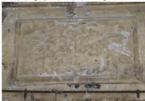
شکل ۴- مرغ بسم الله مثنی بر سردر سرای گمرک