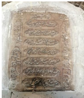
شکل ۱- کتیبه مربوط به جمادی الاول ۱۲۶۰ ه.ق که نام محمد شاه قاجار و صاحب اختیار بر آن نقش بسته است.

در طبقه دوم آن ایوان های کوچکی قرار دارد و دارای ازراه های سنگی خوش تراش و حوض و پاشویه از سنگ سرخ فام است. در گذشته در جنوب غربی میان‌سرای آن، بنایی دارای زیر زمین به منظور ازدیاد انبار و حجره ساخته شد (اسلامی، ۱۳۵۴: ۲۷)، در سال ۱۳۱۹ ه.ش به منظور دسترسی آسان کسبه بازار وکیل شمالی به مسجد، در محل این بنای الحاقی، مسجد حسین بن علی (ع) ساخته شد که در طرح مرمت سازه های وکیلی در تاریخ ۲۴ خرداد ۱۴۰۰ ه.ش تخریب شد. درهای زندی این کاروان‌سرای به صورت مشیک چوبی با اتصالات کام و زبانه بود و دارای سه درک (لنگه) ارسی است. چهار راه ارتباطی در چهار گوشه این سرا و هر یک با دو رشته پلکان به اشکوب بالا راه دارد. حجره های اشکوب دوم بوسیله یک در چوبی به دو قسمت تقسیم شده‌اند و سمت چپ ورودی این کاروان‌سرا به کال‌انبار گشوده می‌شود (کمالی سروستانی، ۱۳۸۴: ۳۲۰). نظارت بر داد و ستد در دوره صفوی بر عهده محتسب بود و این وظیفه در دوره کریم‌خان بر عهده بیگلربیگی و داروغه بود که خود زیر نظر بیگلربیگی فعالیت داشت و این ماموریت در دوره جانشینان کریم‌خان زند بر عهده کلانتر شهر بود که حکم شهردار را نیز داشت. او در دفتری در گمرک‌خانه مسئول ارزش گذاری بار و مالیات‌گیری از آن‌ها بود (رنجبر و صفی پور، ۱۳۸۹: ۱/ ۲۶۱-۲۶۳).