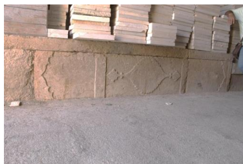
شکل ۷- ازاره سنگی دالان شمالی سرای احمدی با نقش ترنج