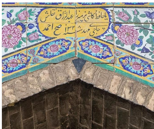
شکل ۶- کتیبه کاشی غرب میان‌سرا