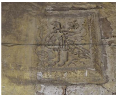
شکل ۵- مرغ بسم الله مثنی بر سردر سرای روغنی برای درک بهتر کتیبه سرای گمرک که نیمی از آن در زیر لایه‌ای از گچ پوشانده شده است.

کتیبه ای بر سردر ورودی سرای گمرک در بازار وکیل قرار دارد که مرغ بسم الله مثنی را نشان می‌دهد. مرغ بسم الله به مجموعه آثار هنری از نقوش پرندگان شامل قو، کبوتر، لک لک، عقاب و هدهد گفته می‌شود که اغلب با بسم الله الرحمن الرحیم یا برخی ادعیه مانند نادعلی خوش‌نویسی می‌شوند. شکل ظاهری این پرندگان در قیاس با پرندگان مرغ بسم الله ممکن است قدری متفاوت باشد یا تنه در یک یا دو ویژگی ظاهری به شکل طبیعی پرند در طبیعت نزدیک باشد. ترکیب‌های مرغ بسم الله با مهارت و وسواس بسیار انجام می‌شد و میان خط، نقش و تزیین هماهنگی ظاهری ایجاد می‌شد (افضل طوسی و جلالیان فرد، ۱۳۹۷: ۳۲). این کتیبه دو کبوتر را در مقابل یک‌دیگر نشان می‌دهد و از این رو مرغ بسم الله مثنی نامیده می‌شود. این کتیبه بسیار مخدوش شده است اما مشابه این کتیبه بر سردر سرای روغنی نیز قرار دارد که وضوح بیشتری دارد.