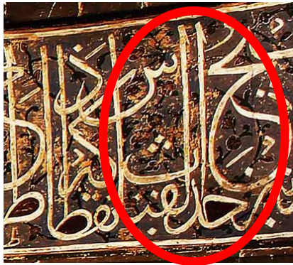
شکل ۴- درج کلمه حدث و القیاس در کتیبه (مأخذ: دلشاد، ۱۴۰۰)

پس دوباره کتیبه را بازخوانی شد این بار بدین صورت: "طرح هر اساس کریاس وسیع که مهندس تیز احداث صحیح القیاس ذنقطاکه" یا حتی با جابه‌جایی کلمات آن را این‌گونه نیز می‌توان خواند: "نقطاذکه طرح هر اساس وسیع کریاس، که مهندس صحیح القیاس تیز احداث".