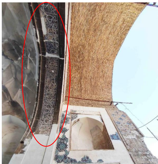
شکل ۲- ایوان جنوبی، کتیبه زیر تویزه، تکنیک ترکیبی خط و نقاشی بر گچ

یکدیگر بر کرسی مجزا بیفتند، اما آنچه مسلم است این است که بر یک کرسی ترتیب و نظم کلمات در هم نخواهد ریخت (قلیچ-خانی، ۱۳۹۰: ۲۹۷ و ۲۹۸).