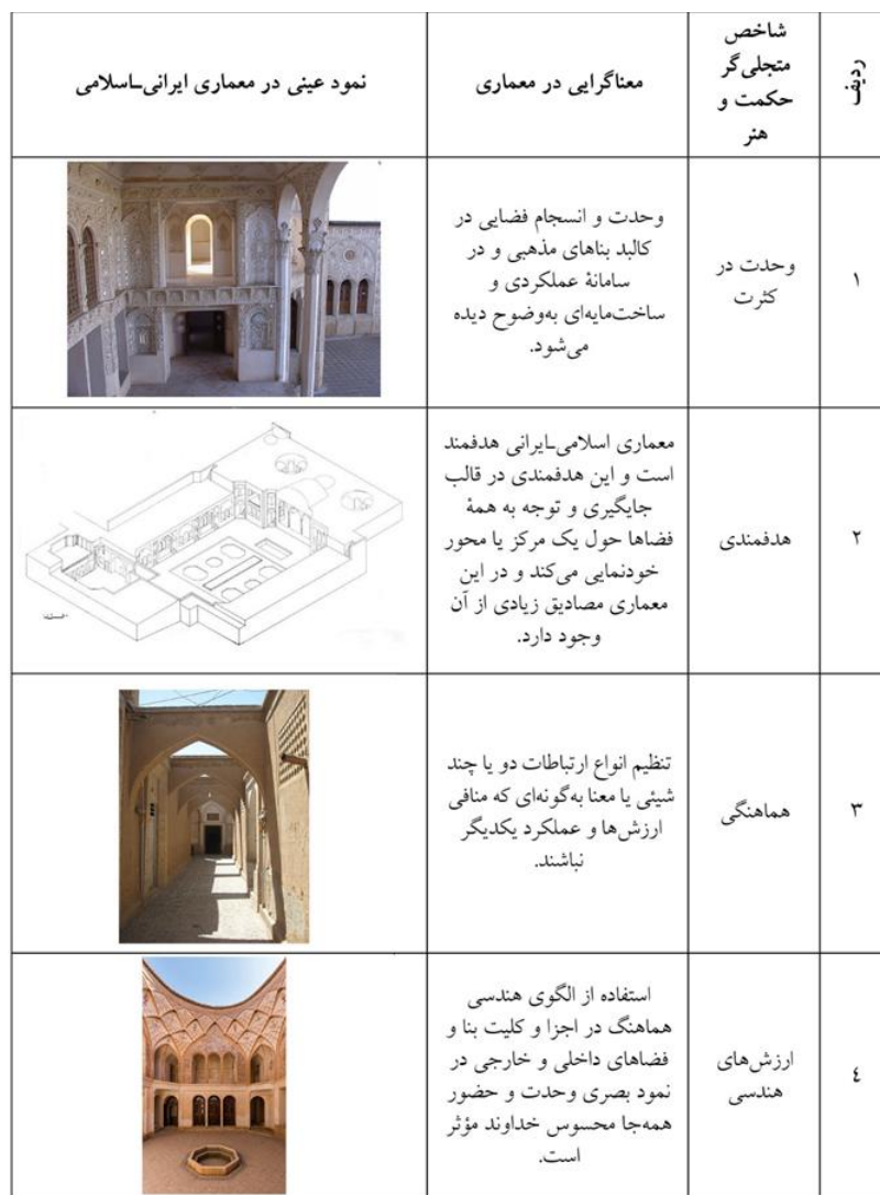
جدول ۲، بررسی شاخص متجلی گر حکمت و هنر در خانه طباطبایی ها؛ ماخذ: نگارندگان

خانه طباطبایی ها در کاشان به ثبت رسیده، در نیمه دوم سده ۱۳ هجری مصادف با دوره قاجاریه جعفر احداث شده است. این خانه ۴۷۳۰ مترمربع وسعت دارد. به دلیل آنکه صاحب خانه در کار تجارت فرش بود کلیه نقوش گچ بری از نقش های فرش ایرانی و گل و مرغ اسلیمی الهام گرفتند و در نهایت شکوه اجرا شدند. این خانه مشتمل بر چهار صحن و حیاط می شود که حیاط مرکزی متعلق به قسمت بیرونی و دو حیاط متعلق به اندرونی و یک حیاط متعلق به خدمه بوده است. قسمت اندرونی خانه شامل اتاق پنج دری ساده در مرکز و دو حیاط در دو طرف آن و دارای سرداب هایی که بادگیرها هوا را در آن جریان می دهند که این قسمت محل سکونت خانواده طباطبایی بوده است. قسمت بیرونی خانه شامل تالار بزرگ (شاه نشین) در مرکز با نورگیرها و پنجره های مشبک رنگی و پنجره های کناری دو جداره که عمودی باز و بسته می شوند. این اتاق دارای تزیینات نقاشی و آینه کاری و گچبری های جالب از جمله پنجره های مشبک گچی است که همچون پارچه توری ظریفی به نظر می رسد