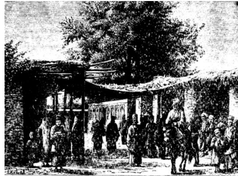
شکل ۱- نقاشی بازارچه‌ای در مدخل شمالی شهر شیراز در دوره قاجار و امکانات رفاهی حاصل شده از وجود آن (مآخذ: دیالوفوا، ۱۳۷۱).

نام‌گذاری بازارچه‌ها بر اساس نام بانی، دروازه نزدیک به بازارچه، بنای مهم نزدیک به بازارچه، فعالیت شاخص بازارچه، شخص بزرگتر بازارچه، شکل ظاهری بازارچه و غیره صورت می‌گرفت. وجود بازارچه‌ها علاوه بر آن که مایحتاج مردم را تامین می‌کرد در بالا بردن امنیت محله نیز موثر بود و سبب ایجاد مراکز تجمع و پاتوق‌ها در محله‌ها می‌شد. گاهی هر محله، یک بازارچه اصلی و چند بازارچه فرعی داشت. برگزاری مراسم جمعی چون روضه‌خوانی‌ها در این گذرها صورت می‌گرفت که نشانگر نقش مهم این محورها در تعاملات اجتماعی است و مخارج این روضه‌خوانی‌ها نیز اغلب بر عهده دکان‌داران بود که آن نیز نشانگر نقش مهم دکان‌داران در رویدادهای اجتماعی است.