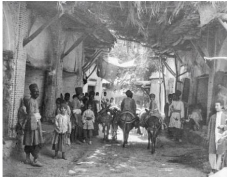
شکل ۲- بازارچه‌ای در شیراز مربوط به سال ۱۹۱۳ میلادی با پوششی موقت از چوب و بوریا، دکان‌دارانی که به تماشا ایستاده‌اند و سوارانی که نمود واژه گذر برای محور این بازارچه‌ها هستند. بازارچه‌ها محل برقراری تعاملات اجتماعی بسیاری در هر محله بودند.

به دروازه شهر و یا در مهمترین بخش یک محله قرار داشتند. مرز میان محلات توسط معابر از هم تفکیک و مرکز هر محله به مرکز شهر توسط معابر مرتبط می‌شد و شبکه‌های اصلی شهر با دروازه‌ها منطبق بودند (مهریار و دیگران، ۱۳۷۸: ۶۶ و ۶۷).