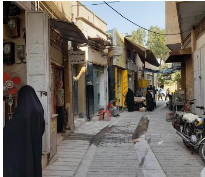
شکل ۳- بازارچه تل قوامی به عنوان یکی از بازارچه‌های تاریخی فعال و زنده بافت تاریخی شیراز (مآخذ: نگارندگان).