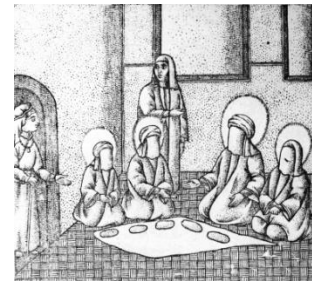
تصویر ۷- افطار خود بخشیدن اهل بیت(ع)، تحفه‌الذاکرین، ۱۲۷۸ق.