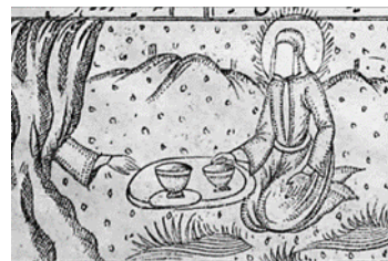
تصویر ۱۰- همسفره شدن حضرت علی(ع) با حضرت محمد(ص) در سفر معراج، معراج‌نامه، ۱۲۹۱ق.