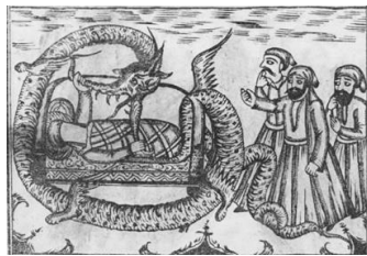
تصویر ۱۴- دریدن اژدها در مهد توسط حضرت علی(ع)، تحفه‌المجالس، ۱۲۷۳ ق.