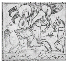
تصویر ۲۰- زورآزمایی حضرت علی(ع) با رستم، رستم نامه، ۱۳۲۹ق.