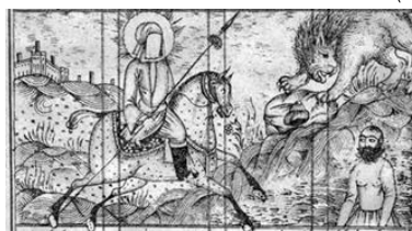
تصویر ۱۹- نجات سلمان در دشت ارژن توسط حضرت علی(ع)، حمله حیدری، ۱۲۸۲ ق.