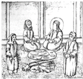
تصویر ۱۸- زنده شدن پسران قصاب به دعای حضرت علی (ع)، تحفه‌الذاکرین، ۱۲۷۸ ق.

جوانمرد قصاب که در فتوت‌نامه‌ها پیر و پیشوای جوانمردان صنف قصاب بوده، معروف است به این که یار امیرالمؤمنین علی (ع) بوده است (افشاری، ۱۳۸۴: ۲۲۴). در رساله‌ای درباره‌ی قصابان و سلاخان (ظاهراً) از عهد صفوی داستانی در مورد جوانمرد قصاب که به خاطر نشانختن حضرت علی (ع) و بی‌احترامی به ایشان دست خود را قطع و چشمان خود را با کارد کنده بود و حضرت دست و چشمان وی را شفا داد ذکر شده است (مدائینی و افشاری، ۱۳۸۱: ۱۸۷). فریدالدین عطار نیشابوری هم در اشعارش به این کرامت حضرت علی (ع) اشاره نموده است (وکیلیان، ۱۳۸۰: ۷۱). در مجلس تعزیه‌ای که در شب شهادت حضرت علی (ع) برگزار می‌شده این داستان اجرا می‌شده است (شهیدی، ۱۳۸۰: ۲۹۰). داستان جوانمرد قصاب در کتاب تحفه‌الذاکرین نیز با تغییراتی ذکر شده که در آن با کرامت و دعای حضرت علی (ع) فرزندان قصاب زنده می‌شوند. به نظر می‌رسد این داستان‌ها بیانگر ایمان مردم به کرامات حضرت علی (ع) و باور آن‌ها به پاکدلی جوانمرد قصاب است (تصویر ۱۸).