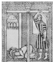
تصویر ۲- ضربت خوردن امیرالمؤمنین، اسرارالشهادت ۱۲۶۸ ق.