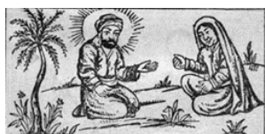
تصویر ۲۱- حضرت علی(ع) و پیرزن، داستان عاق والدین، ۱۳۲۶ق.

این کتاب از جمله آثار ادبیات عامه و مکتب‌خانه‌ای از سراینده‌ای ناشناس است که مضمون آن نکات اخلاقی و عبرت‌آموز بر اساس باورهای دینی و احادیث مربوط به احترام و نیکی به پدر و مادر است (ذوالفقاری و حیدری، ۱۳۹۵: ۴۷۶). داستان به این شرح است که روزی سلمان فارسی به قبرستان بقیع می‌رود که می‌بیند از قبری آتش برمی‌خیزد. پس به خدمت رسول خدا رفته و ماجرا را می‌گوید. پیامبر(ص) به همراه اهل بیت(ع) به قبرستان رفته و می‌گوید که صاحب این قبر مورد نفرین مادرش قرار گرفته است. پنج تن آل عبا یکی پس از دیگری به نزد پیرزن رفته و شفاعت او را می‌کنند تا اینکه بالاخره مادر جوان با شفاعت امام حسین(ع) پسرش را می‌بخشد(تصویر ۲۱). بر اساس این داستان مجلس تعزیه‌ای در دوران قاجار اجرا می‌شده است (شهیدی، ۱۳۸۰: ۲۹۳).