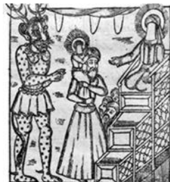
تصویر ۱۷- آمدن دیو خدمت حضرت محمد (ص) و حضرت علی (ع)، فارغ‌نامه، ۱۲۶۹ ق.