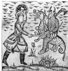
تصویر ۱۵- نبرد حضرت علی(ع) با غول و اژدها، فارغ‌نامه، ۱۲۸۰ ق.

در روایات حماسی و داستان‌های عامه، اژدها مظهر خشکسالی، بلا، و شر است و قهرمان با از میان برداشتن او نعمت و آسایش را به مردمان باز می‌گرداند (پاکباز، ۱۳۸۷: ۹۶۸). در آثار عامیانه فارسی معروف‌ترین قهرمان اژدهاکش پس از اسلام حضرت علی(ع) است که در میان شیعیان به قهرمانان ملی پیوسته است. شکل‌های نمادین، تمثیلی و کنایی در این اژدهاکشی‌ها بسیار است و حتی شکل تقدیسی مثلاً در اژدهاکشی امام اول شیعیان دیده می‌شود. در برخی داستان‌های عامه مار یا اژدها گاه نگهبان گنج است و گاه نماد دشمن و نفس (موسوی بجنوردی و حصوری، ۱۳۹۱: ۴۰۵-۴۱۳). داستان‌های فراوانی از رویارویی و نبرد حضرت علی(ع) با اژدها در منابع ادبیات عامه مانند خاوران‌نامه، جنگ‌نامه‌ی محمد حنفیه و فارغ‌نامه‌ی گیلانی آمده است. در اکثر این داستان‌ها اژدها نماینده و نماد پلیدی‌هاست که توسط حضرت علی(ع) نابود می‌شود (تصویر ۱۵).