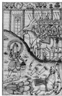
تصویر ۵- نبرد حضرت علی(ع) با عمرو بن عبدود، مجالس المتقین، ۱۲۶۶ق.