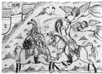
تصویر ۶- نبرد حضرت علی(ع) با مرحب خیبری، طوفان البكاء ۱۲۹۸ق.