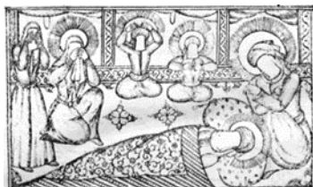
تصویر ۱- لیله‌المبیت، حمله حیدری، ۱۲۸۲ ق.

داستان‌هایی مانند تولد در کعبه، خوابیدن ایشان به جای پیامبر (ص) در لیله‌المبیت (تصویر ۱)، تولد سیدالشهدا، ضربت خوردن در محراب (تصویر ۲)، ماجرای مباحله، وفات حضرت محمد (ص) (تصویر ۳)، واقعه‌ی غدیر خم (تصویر ۴)، رشادت‌ها و دلآوری‌های ایشان در غزوات صدر اسلام مانند غزوه بدر، غزوه احد، غزوه خندق و نبرد با عمروبن عبدود (تصویر ۵)، غزوه خیبر و شکست دادن مرحب یهودی (تصویر ۶)، گشودن در خیبر و جنگ‌های زمان خلافت، از مهم‌ترین و محبوب‌ترین داستان‌هایی است که در کتب چاپ سنگی مورد تصویرپردازی قرار گرفته و بر اساس رخدادها و حوادث تاریخی شکل گرفته است و نشان از باورها و اعتقادات نگارندگان و هنرمندان و مخاطبین این آثار نسبت به حقانیت، ولایت و شخصیت والای امام اول شیعیان دارد.