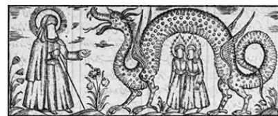
تصویر ۱۶- داستان حسنین (ع)، جامع‌المعجزات، ۱۲۷۱ ق.