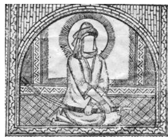
تصویر ۲۲- شمایل حضرت علی(ع)، فارغ‌نامه، ۱۲۶۹ ق.

همان‌طور که مشاهده شد، داستان‌هایی بیشتر مورد توجه تصویرگران قرار می‌گرفت که اغلب به صورت شفاهی در محافل عمومی نیز رواج داشت. اشتراک مضامین این تصاویر با مضامین دیگر هنرهای مردمی و ادبیات عامه‌ی شفاهی مانند تعزیه‌گردانی، حمله‌خوانی، پرده‌خوانی، شمایل‌گردانی و نقالی نشان از خاستگاه مشترک آن‌هاست که همان باورها، اعتقادات، علایق، نیازها و آمال مردم است که ریشه در کلام الهی، احادیث و روایات و متون مذهبی و در یک کلام مکتب تشیع دارد. مکتبی که در رأس آن بعد از حضرت محمد(ص)، حضرت علی(ع) والاترین جایگاه و مقام را دارد. ارادت و علاقه و باور مردم به ایشان به عنوان رهبر و انسان کامل و آرمانی با شخصیتی فرامکانی و فرازمانی و با قدرت اعجاز و نماد برتری و پیروزی بر مظاهر شر مانند دیوها، غول‌ها، اژدها و شخصیت‌های کافر و بداندیش، و یاری‌رسان و حامی مردمان به ویژه ارادتمندانش، نقش مهمی در پیوند ادبیات عامه، مذهب و هنر تصویری داشته است که بارزترین جلوه‌ی این پیوند در دوران قاجار، نقاشی‌های کتب چاپ سنگی است. در این تحقیق، تمامی تصاویر گردآوری شده از منابع مختلف که در ارتباط با حضرت علی(ع) می‌باشند، از نظر مضمون مورد بررسی و طبقه‌بندی قرار گرفت که در جدول (۲) نشان داده شده است.