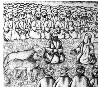
تصویر ۹- تکلم حضرت علی(ع) با شیر و گرگ، تحفه‌الذاکرین، ۱۲۷۸ق

از داستان‌های مورد علاقه‌ی مردم در ادبیات عامه‌ی ایران داستان مربوط به کرامات و معجزات حضرت علی(ع) است که از آیات کلام وحی مانند سوره‌ی مائده (آیه ۵۵)، سوره‌ی بقره (آیه ۲۷۴)، سوره‌ی انسان و روایات مختلف در این باب اخذ شده است (تصویر ۷). برخی از این داستان‌ها در تحفه‌المجالس، تحفه‌الذاکرین، جامع‌المعجزات و فارغ‌نامه‌ی گیلانی به عنوان معجزاتی از حضرت ذکر شده است و در این حکایات سخاوت و کرامات ایشان باعث اسلام آوردن کافران می‌گردد. به عنوان مثال در منظومه‌ی فارغ‌گیلانی در مورد سخاوت حضرت علی(ع) داستانی ذکر شده است که در آن سائل کوری از حضرت تقاضای نان می‌کند. حضرت به قنبر می‌گوید که به او نان بده و قنبر می‌گوید که نان در خون و خون در بار و بار بر شتر و شتر به قطار شتران دیگر بسته است و حضرت قطار شتران را به سائل می‌بخشد و کور را هم بینا می‌گرداند (تصویر ۸). همچنین داستان تکلم شیر و گرگ با حیدر صفدر به عنوان معجزه‌ای از حضرت، مضمون برخی از تصاویر نقاشی‌های دوران قاجار و کتب چاپ سنگی قرار می‌گیرد که نشان‌دهنده‌ی محبوبیت آن در نزد مردم آن دوره دارد. تصویری از این داستان در کتاب تحفه‌الذاکرین و نیز طوفان البكاء آورده شده است (تصویر ۹).