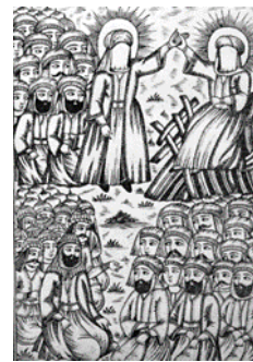
تصویر ۴- غدیر خم، افتخارنامه حیدری، ۱۳۱۰ق.