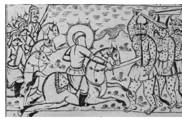
تصویر ۱۳- نبرد حضرت علی(ع) با دیوان، خاورنامه، ۱۲۸۳ ق.