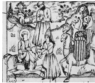
تصویر ۸- بخشیدن شتران توسط حضرت علی(ع)، فارغ‌نامه، ۱۲۷۴ق.