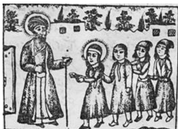
تصویر ۱۲- سلام دادن حضرت علی(ع) در کودکی به خضر(ع)، معراج‌نامه، ۱۲۶۳ق.

حضرت علی(ع) و حضرت خضر(ع) هردو قهرمان قصه‌های مشکل‌گشا در فرهنگ و ادبیات عامه هستند. داستان منظومی هم درباره‌ی خضر نبی(ع) و مولا علی(ع) وجود دارد که در دوران قاجار بارها به صورت کتابچه‌ی کوچک و گاهی نیز همراه معراج‌نامه در یک کتاب چاپ می‌شده است. در این داستان عامه حضرت علی(ع) که هنوز کودک نابالغی است بارها با حضرت خضر دیدار می‌کند و در آخر داستان از حضرت خضر می‌خواهد که همیشه یار و یاور شیعیان باشد. در فرهنگ عامه و ادبیات فارسی و مآثورات دینی، گزارش‌هایی از دیدار حضرت علی(ع) با حضرت خضر(ع) ذکر شده است. بر اساس روایات متعدد خضر(ع) یک بار در مسجدالنبی و یک بار در نخيله ۱ به حضور حضرت علی(ع) رسیده و یک بار هم هنگام ارتحال رسول خدا(ص) به اهل بیت تسلیت گفته است(ذوالفقاری و حیدری، ۱۳۹۵: ۳۱۶-۳۱۷). به نظر می‌رسد این روایات و همچنین باور شیعیان در مورد حضور حضرت علی(ع) در همه‌ی مکان‌ها و زمان‌ها زمینه‌ای برای پرداختن به این داستان‌ها شده است(تصویر ۱۲).