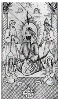
تصویر ۲۴- شمایل حضرت علی(ع) با حسنین(ع)، طوفان البکاء ۱۲۹۸ ق.