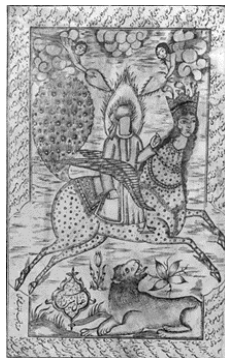
تصویر ۱۱- خاتم بخشی حضرت محمد(ص) به شیر در سفر معراج، تحفه‌المجالس، ۱۲۷۳ق.