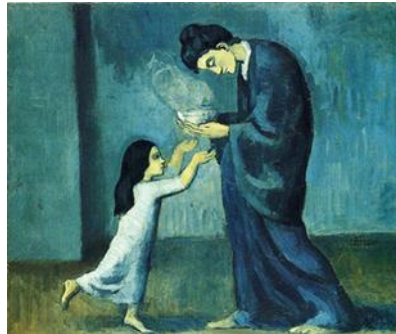
تصویر ۳- «سوپ» یا «مادر و کودک»، ۱۹۰۲- ۱۹۰۳، رنگ روغن روی بوم، ۳۸.۵ × ۴۶ (URL3)