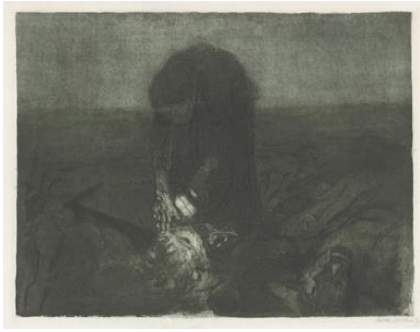
تصویر ۷- میدان نبرد، ۱۹۰۷، حکاکی خطی، درای پوینت، آکواتینت، سمباده، ورنیس مو با چاپ از طریق کاغذ لایه گذاری شده و کاغذ انتقال زیگلر، چاپ شده به رنگ سبز- مشکی (URL7)