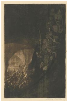
تصویر ۱۰- سلاح برگیریم (URL9)