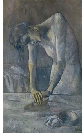
تصویر ۱- زن اتو کش، ۱۹۰۴، رنگ روغن روی بوم، ۱۱۶.۲ × ۷۳ (URL2)