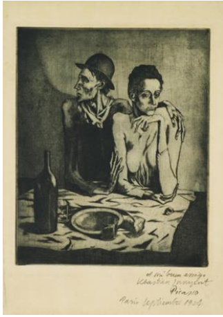
تصویر ۲- غذای بخورونمیر، ۱۹۰۴، اسپینگ، (URL1)