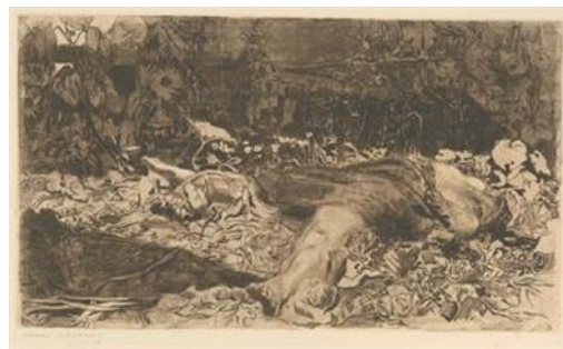
تصویر ۸- تجاوز شده (URL8)