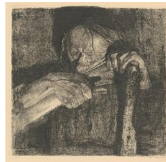
تصویر ۹- تیز کردن داس (URL10)

«در مجموعه دراماتیک جنگ دهقانی، روند حوادث از تحریک، واکنش، خروش، خشم، شکست و مرگ شکل گرفته اند. کشاورزان نیز چون کارگران برای فرار از فقر و تنگدستی و خلاصی از رنج و دستیابی به زندگی بهتر، به طغیان درمی آیند. نخستین لوحه از مجموعه جنگ دهقانی «شخم زنی» است (تصویر ۵) که تصویری دراماتیک از فقر یک دهقان می باشد. لوحه دوم «تجاوز» (تصویر ۸)، لوحه سوم «تیز کردن داس» (تصویر ۹) و لوحه های چهارم و پنجم «سلاح برگیریم» و «طغیان» نام دارند. (تصاویر ۱۰ و ۱۱) پس از نبرد «عنوان لوحه ششم است (تصویر ۷) که در آن مادری در جستجوی جوی فرزند مرده خود می باشد. لوحه پایانی، که آخرین مرحله از جنگ دهقانی است «زندانیان» می باشد. (تصویر ۶) آنچه در این میان باید به آن اشاره کرد، این است که قهرمان همه مراحل این مجموعه دراماتیک، یک زن است. کته از این به بعد درآثارش به زن توجه بیشتری می کند، زنانی که او ترسیم کرده، کمتر نشانی از حالت فریبده و اغوا کننده زنانگی دارند. آنچه هست «مادری» است مغموم، پریشان، عاصی. «(مهاجر، ۱۳۶۹، ۵۵)