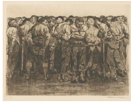
تصویر ۶- زندانیان، ۱۹۰۸، حکاکی خطی، نقطه خشک، سمباده، ورنیس مو با چاپ پارچه و کاغذ انتقال زیگلر (URL6)