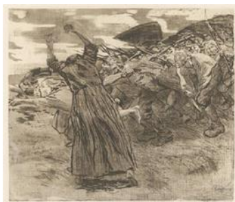
تصویر ۱۱- طغیان (URL11)