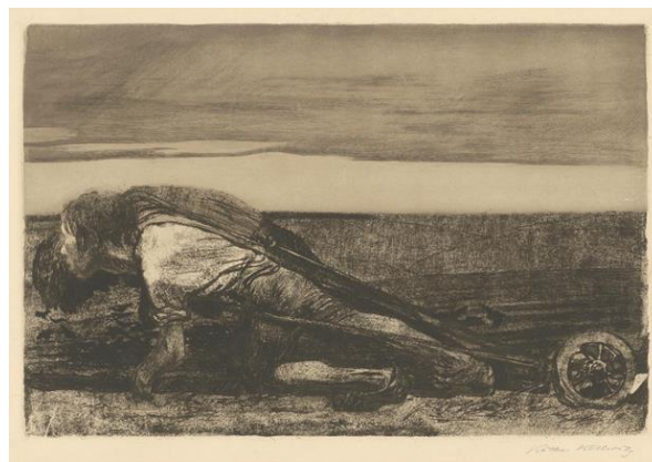
تصویر ۵- شخم زدن ۱۹۰۷، حکاکی خطی، قلم زنی درای پوینت، آکواتینت، قلم زنی ذخیره ای، سنباده، نوک سوزنی و قلم زنی ورنی با چاپ از کاغذ انتقال زیگلر (URL5)

کته کلویتس ۳ (۱۸۶۷-۱۹۴۵)، از برجسته ترین هنرمندان واقع گرای اجتماعی آلمان در نیمه نخست سده بیستم به شمار می آید. تجربه زندگی در محله فقیر نشین برلین، بهترین طراحی ها و باسمه هایش را در مضمون های مادر و بچه، نابسامانی اجتماعی، کار و مبارزه تهیدستان به بار آورد. (پاکباز، ۱۳۹۷، ۵۴۱). او اولین زنی بود که به عضویت آکادمی هنر پروس در سال ۱۹۱۹ درآمد. سبک وی از رئالیسم آثار اولیه او به رویکردی اکسپرسیونیستی تر تبدیل شد. تکنیک های او شامل حکاکی، لیتو گرافی، حکاکی روی چوب و بعداً مجسمه سازی بود که اغلب روش هایی را برای دستیابی به اثرات دلخواه ترکیب می کرد. رامبراند، گویا و دومیه الهام بخش او بودند. آثار او به شدت تحت تاثیر مسائل اجتماعی، فقر، گرسنگی و جنگ بود و او را به یکی از هنرمندان برجسته اکسپرسیونیسم تبدیل کرد. کته کلویتس در طراحی ها و نقاشی هایش از خطوط قوی و واضح استفاده می کرد تا احساسات شدید و عمیقی را به بیننده منتقل کند. آثارش غالباً بیانگر مبارزه های اجتماعی و شخصی انسان ها در برابر ناملایمات بودند و از آن ها به عنوان ابزاری برای اعتراض و نقد اجتماعی استفاده می کرد. رنگ ها در آثار کته کلویتس محدود و اغلب خاکی و تیره بودند. این رنگ ها به طور عمدی انتخاب می شدند تا احساس غم، ناامیدی و فقر را منتقل کنند. در عین حال او از نور پردازی های بسیار کنترل شده استفاده می کرد تا دراماتیک بودن و شدت احساسات موجود در آثارش را نشان دهد.