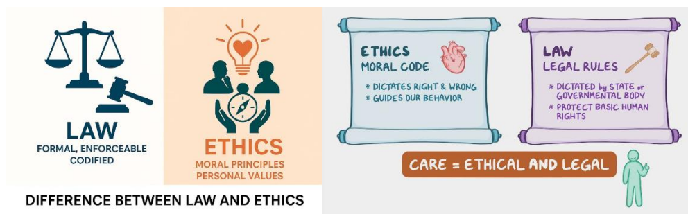
شکل ۱- نمودار تفاوت و همپوشانی اخلاق و قانون (مأخذ: وبسایت John Bandler)

امنیت شهروندی مفهومی چندبعدی است که شامل امنیت فردی، اجتماعی، روانی و حقوقی می‌شود. در این میان، اخلاق اجتماعی نقش تعیین‌کننده‌ی در تحقق امنیت دارد؛ زیرا رعایت اصول اخلاقی در تعاملات اجتماعی، بستر اعتماد عمومی و احساس عدالت را فراهم می‌کند (Beetham, 2013: 55). هنگامی که شهروندان نسبت به رعایت انصاف و احترام متقابل اطمینان داشته باشند، احتمال بروز تنش‌های اجتماعی و رفتارهای خلاف قانون کاهش می‌یابد (زارعی، ۱۳۹۸: ۶۸). در جوامعی که ارزش‌های اخلاقی تضعیف شده است، قانون به تنهایی نمی‌تواند امنیت پایدار ایجاد کند؛ زیرا نظم اجتماعی نیازمند پذیرش درونی هنجارهاست، نه صرفاً الزام بیرونی. بر این اساس، اخلاق به‌منزله‌ی عامل نرم‌افزاری امنیت، مکمل ابزارهای سخت‌افزاری نظیر قانون و پلیس محسوب می‌شود (موسوی، ۱۳۹۴: ۵۸).