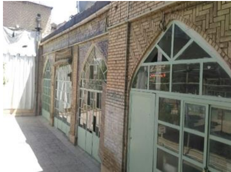
شکل ۴- مسجد امام سجاده (ع)