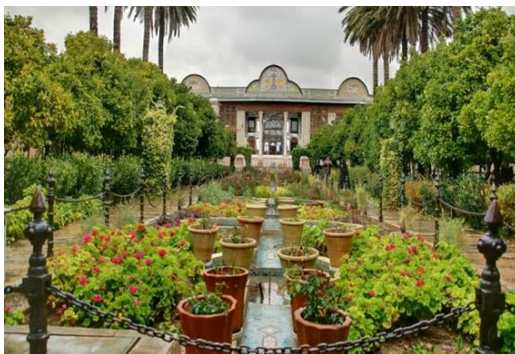
شکل ۲- نارنجستان قوام