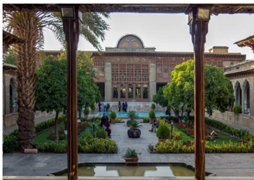
شکل ۳- خانه زینت الملک