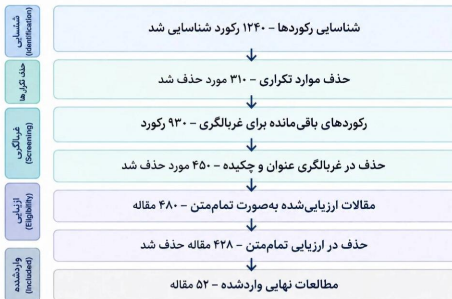
شکل ۲. فلوجارت فرایند انتخاب مطالعات بر اساس استانداردهای PRISMA 2020؛ نمایش مراحل شناسایی تا انتخاب مطالعات نهایی در حوزه گردشگری احیاگر

داده‌های مستخرج از مقالات نهایی با استفاده از تحلیل تماتیک (Thematic Analysis) و روش کدگذاری سه‌مرحله‌ای (باز، محوری و گزینشی) مورد واکاوی قرار گرفتند (Braun & Clarke, 2006). در این فرایند، ابتدا مؤلفه‌های کلیدی گردشگری احیاگر شناسایی، سپس پیوندهای علی و معلولی آن‌ها با تاب‌آوری اکولوژیکی استخراج و در نهایت، چارچوب مفهومی ارائه شده در مقاله (مدل پیشنهادی) بر اساس این یافته‌ها تدوین و اعتبارسنجی گردید. این روش اجازه داد تا شکاف‌های پژوهشی (Research Gaps) در زمینه مدیریت مقاصد طبیعت‌گردی به‌دقت شناسایی شوند. به‌منظور تضمین شفافیت و تکرارپذیری پژوهش، فرایند شناسایی، غربالگری و انتخاب نهایی مقالات بر اساس پروتکل استاندارد PRISMA 2020 انجام شد. جزئیات مراحل حذف رکوردهای تکراری، ارزیابی شایستگی بر اساس معیارهای ورود و خروج، و در نهایت انتخاب ۵۲ مقاله نهایی برای تحلیل تماتیک در شکل ۲ ارائه شده است. لیست کامل در پیوست مقاله