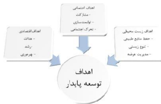
شکل ۲. اهداف توسعه پایدار (خسروانی و همکاران، ۱۳۹۳)

توسعه پایدار با حفاظت زمین، آب و ذخایر ژنتیکی گیاهی و جانوری همراه است و تخریب زیست محیطی به همراه ندارد، از فناوری مناسب استفاده می کند، از نظر اقتصادی بالنده و پایدار و از نظر اجتماعی مورد قبول است، بنابراین اهداف توسعه پایدار را در سه بخش اقتصادی (با هدف پیشرفت و کارایی بیشتر)، اجتماعی (با هدف برابری و کاهش فقر) و بوم شناختی (با هدف حفظ توانمندی منابع طبیعی) می توان در نظر داشت. (خسروانی و همکاران، ۱۳۹۳)