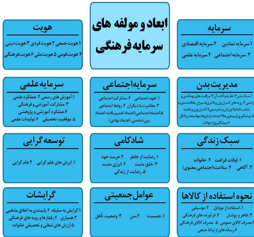
شکل ۲- ابعاد و مؤلفه‌های سرمایه اجتماعی (ماخذ: نگارندگان)

مرحله ششم: تعیین کیفیت نتایج: محقق جهت کنترل نتایج استخراجی خود از مقایسه نظرات خود با چند خبره دیگر نیز استفاده نموده است و سپس نتایج از طریق شاخص کاپا ارزیابی و مورد تایید قرار گرفت. مرحله هفتم: اعلام نتایج: در این مرحله از روش فرا ترکیب، یافته‌های حاصل از مراحل گذشته در قالب یک مدل بر اساس ابعاد و مؤلفه‌ها ارائه می‌گردد.