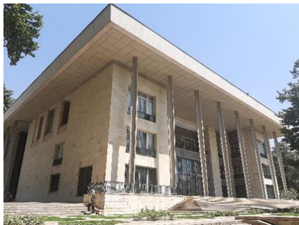
شکل ۲- کاخ نیاوران

دانست. شاید بتوان این جریان وطنی را مدرن باستانی نام برد (بانی مسعود، ۱۳۸۸) حکومت پهلوی یعنی از شهریور ۱۳۲۰ تا سقوط این سلسله بهمن ۱۳۵۷ شاهد تغییرات جدی در اندیشه‌ها و سبک‌های معماری هستیم به نحوی که با از میان رفتن حکومت مقتدر رضاخان شاهد افول و حذف معماری باستان‌گرا و ظهور سبک‌های جدیدی در معماری هستیم. که البته روند تغییرات در معماری این دوره بسیار پر افت و خیز می‌باشد. با گذشت زمان گرایش دیگری در معماری ایرانی به وجود آمد. بخش اول آن را که می‌توان سبک بین‌المللی یا جهانی نام نهاد، شامل ساختمان‌ها و مجموعه‌هایی هستند که در وهله اول کارکرد گرایبی را مورد توجه قرار داده‌اند و همانند جریان اصلی معماری مدرن در اروپا و آمریکا ضد تاریخ عمل کرده و نیازی به تکرار و یا استفاده از مفاهیم، عناصر و اشکال معماری گذشته نمی‌دیدند. در این دوران استفاده گسترده از مصالح ساختمانی جدید مانند بتن مسلح، آهن و شیشه، به تغییر زبان معماری یاری رساند. این ساختمانها هیچ ویژگی بومی، تاریخی یا فرهنگی محیط خود را منعکس نمی‌کردند؛ بلکه با دور شدن از تزیینات اضافی، سعی در کارآمد بودن داشتند. سبک بین‌المللی در دوران رواج خود در بسیاری شهرها و پایتخت‌های دنیا تکرار میشد و حاصل آن بناهایی بود با خصوصیات کم و بیش یکسان اما در موقعیتهای جغرافیایی و فرهنگی مختلف. اما گرایش دوم در بین معماران ایرانی، گرایشی بود که سعی در استفاده مجدد از مفاهیم، عناصر و اشکال معماری گذشته ایرانی داشت؛ اما نه به صورت تکرار یا تقلید آن عناصر در ساختمان‌های جدید، بلکه