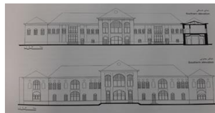
شکل ۳- نمای کاخ صاحبقرانیه