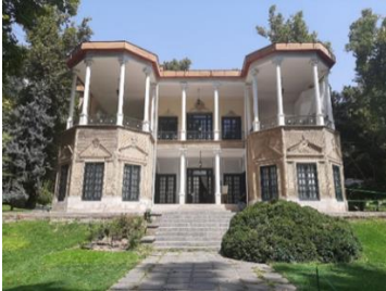
شکل ۱- کوشک احمدشاهی

این بنا از دوره احمد شاه قاجار یک کاخ مهم در مجموعه کاخ‌های نیاوران در شمال تهران باقی مانده است. این کاخ که به کوشک احمدشاهی معروف است. تا حدی شبیه کاخ ملیجک (احداث شده در سال ۱۳۱۳ ه.ق) واقع در مجموعه کاخ سپهسالار است. علاوه بر کوشک احمدشاهی در این زمان در تهران این گونه آجرهای مهردار که در ساخت کوشک احمدشاهی بکار برده شده را می‌توان بر بدنه کاخ احمدشاهی در مجموعه سعدآباد، خانه قوام السلطنه در خیابان سی تیر، سردر باغ ملی در جنوب میدان مشق و نمای غربی مجلس شورای ملی استفاده شده است.