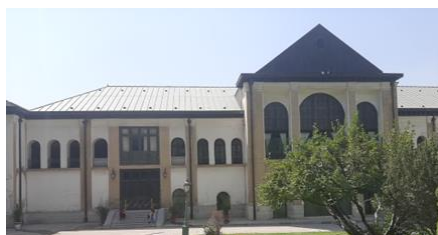
شکل ۴- نمای کاخ صاحبقرانیه