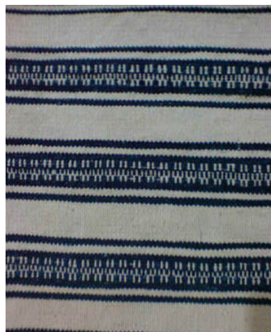
شکل ۳- جاجیم سوزنی‌رند (کشکولی)

این بافته‌ها امروزه علاوه بر روانداز، جهت تزئینات خانگی مثل رو میزی، رو تختی، و..... طرفداران زیادی پیدا کرده است (شکل ۳).