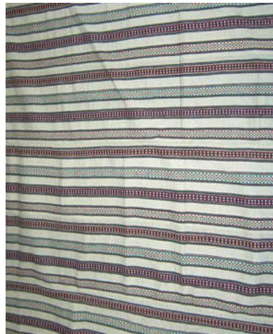
شکل ۲- جاجیم شیشه درمه