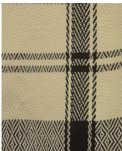
شکل ۱- جاجیم چهارکوجی

این نوع دستبافته رایج‌ترین جاجیم نسبت به سایر جاجیم‌ها می‌باشد که از نظربافت ساده‌تر از انواع دیگر بوده است و از نظر نقش پردازی انواعی دارد که به چند نمونه آن اشاره می‌کنیم (شکل ۱).