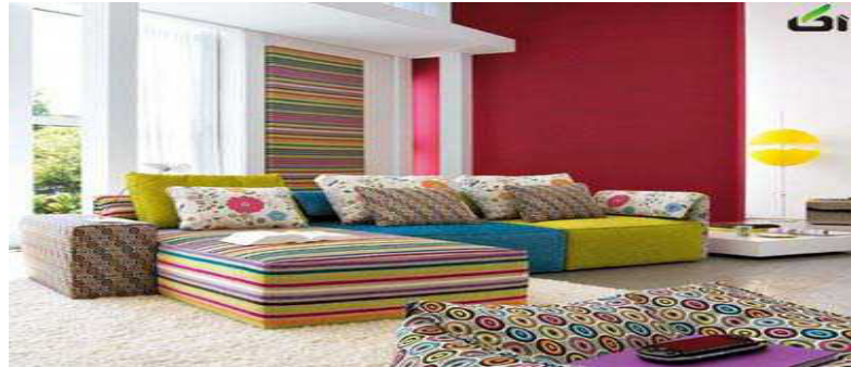
شکل ۵- نمونه‌ای از طرح جاجیم در دکوراسیون داخلی

است که تمامی فضای هتل سمیرامیس یونان را با کودکانه‌ترین رنگ‌ها طراحی و اجرا کرده و در حال حاضر به جهت منحصر به فرد بودنش به شدت جذب توریسم می‌کند. و در نهایت برای مکان‌های رسمی تر مثل دانشگاه‌ها، ادارات و... نیز می‌توان از طیف‌های رنگی دیگری بسته به سلیقه مشتری، نوع سبک دکور آن مکان و فاکتورهای دیگری که ممکن است در هر مکان به صورت خاص وجود داشته باشد استفاده کرد.