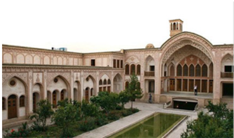
شکل ۴- ویژگی معماری در بنای عامری (کاشان)

ویژگی بارز این بنا وسیع بودن هردو حیاط و همینطور مجلل بودن فضاها و تزئینات این خانه است. از فضاهای مهم معماری این بنا باید از سرداب، شاه نشین، آینه خانه، هفت دری، هشتی ورودی، ایوان تابستانی و ایوان زمستانی، حوضه خانه، بهاربند و دو بادگیر نام برد. تزئینات مقرنس، قطاربندی و رسمی بندی، شاه نشین، یزدی بندی بسیار مفصل ایوان و نقاشی‌های رسمی و تذهیب سقف سرداب این بنا قابل ذکر هستند.