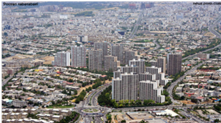
تصویر ۲- نمونه تصویری از شهر

شهر در معنای تاریخی خود، نقطه‌ای است که در آن حداکثر تمرکز قدرت و فرهنگ یک اجتماع متبلور می‌شود. شهر، شکل روابط منسجم اجتماعی و جایگاه مراکز و فعالیت‌های اجتماعی، اقتصادی، سیاسی و... است. در شهر تجاری انسانی به علائم ماندگار، نمادها، الگوهای رفتاری و دستگاه‌های نظم نمایش داده می‌شود.