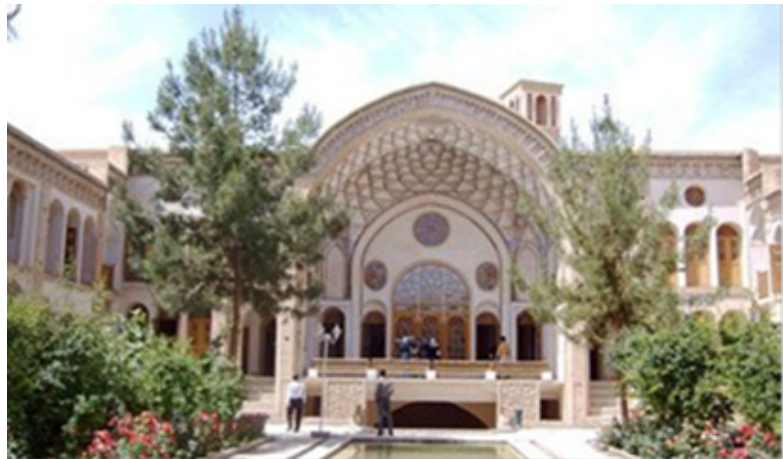
شکل ۳- نمونه تصویری خانه عامری (کاشان)