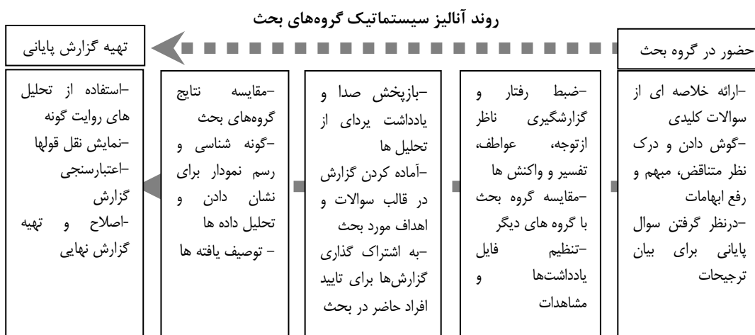
نمودار ۱- روند آنالیز سیستماتیک گروههای بحث، منبع نگارنده با استناد به (Krueger, 2002, 10)

گروه بحث روشی سیستماتیک در رابطه با درک مسائل و مشکلات اجتماعی از طریق مطرح کردن سؤالات خاص با جهت گیریهای ویژه به صورت رسمی و غیررسمی است که اکثر محققین، آن را جهت به دست آوردن اندیشه و عقاید گروه و یا گروههای اجتماعی هدف به کار می برند. به کمک این روش می توان گروهها را قبل از طراحی و همچنین در طولانی مدت در زمان بعد از اجرا ارزیابی نمود. (رفعیان، ۱۳۸۵، ۴۸). این روش یک ارزیابی سریع و جمع آوری داده های نیمه ساختار یافته است که در آن مجموعه ای مبتنی بر هدف به بحث در مورد مسائل و نگرانی هایی بر اساس یک لیست از موضوعات کلیدی که توسط محقق گردآوری شده می پردازند. (Kumar 1987). این روش به عنوان یک ابزار ضروری برای محققان بازاریابی (Krueger 1988) تبدیل شده است که بسیار محبوب بوده و راه سریع برای یادگیری مخاطبان که به دنبال هدف می باشند را فراهم می کند. رسانه ها و مطالعات بازاریابی نشان داده اند که بحث گروهی متمرکز یک تکنیک مقرون به صرفه برای استخراج دیدگاه ها و نظرات از مشتریان بالقوه، مشتریان و کاربران نهایی است. در بخش کشاورزی نیز از گروه های تمرکز جهت به دست آوردن بیش و درک مخاطبان هدف، نیازها، مشکلات، باورها با دلایل و شیوه های خاص استفاده شده است. (Debus 1988) روند آنالیز سیستماتیک گروههای بحث را می توان به ۵ مرحله تقسیم نمود. (نمودار ۱)