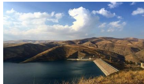
شکل ۴- سد شهر چایی ارومیه که بر روی رودخانه شهر چایی در امتداد روستای بند جریان دارد