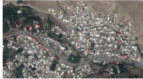
شکل ۲- عکس هوایی، منطقه روستای بند ارومیه

مردم روستای بند اغلب کرد زبان هستند و شغل اصلی آن ها زراعت و دامداری است اما در طی سال های اخیر به دلیل افزایش گردشگران و مسافران در این منطقه، تعداد زیادی از این روستاییان برای ارائه ای خدمات به این گردشگران تغییر شغل داده و همین امر سبب شده که رستوران ها و غذا خوری های و مراکز رفاهی مختلف در تفرجگاه بند ساخته شوند. پیشرفت ساخت وساز در جنوب شهر ارومیه باعث شده که فاصله شهر ارومیه از تفرجگاه بند بسیار کم شود و همین امر سبب شده که مردم به این مکان تفریحی گرایش بیشتری داشته باشند.