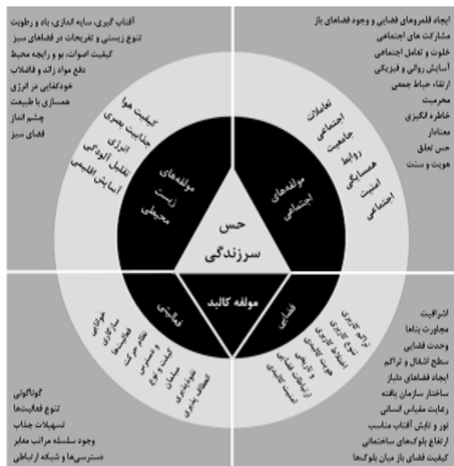
شکل ۶- الگویی کلی از مؤلفه‌های مؤثر برای تأمین سرزندگی در فضای زیستی، مأخذ: طاهر طلوع دل و اشرف السادات، ۱۳۹۶: ۵۸.

بین موجودات زنده رابطه‌ای اجتماعی وجود دارد که متعالی‌ترین شکل آن ویژه انسان است. انسان موجودی اجتماعی است و بسیاری از نیازهای او در جامعه و در تعامل با دیگران تأمین می‌شود. فضاهای جمعی مناسب با جذب افراد و گروه‌های مختلف و ایجاد شرایط مناسب برای شکل‌گیری تعاملات اجتماعی می‌تواند نگرش افراد با پیشینه‌های ذهنی و ویژگی‌های متفاوت را به یکدیگر نزدیک کند و انسان‌ها را در تکمیل رشد روانی و اجتماعی شان یاری دهد (تیموری و یزدانی، ۱۳۹۲: ۹۲-۸۳). دانشور و چرخچیان (۱۳۸۶) بعد از اجتماع پذیری فضا و ابعاد مختلف کالبدی و فعالیت‌های فضاهای عمومی مبتنی بر مراحل زیر بدانییم: پذیرا بودن فضا برای افراد و گروه‌های اجتماعی مختلف، تأمین آسایش روانی و فیزیکی و لذت بردن افراد و گروه‌های اجتماعی از حضور در فضا (دانشور و چرخچیان، ۱۳۸۶: ۲۹-۱۸). بر اساس تعاملات اجتماعی و کلیه مباحث مطرح شده در رابطه با حس تعلق به مکان و حس سرزندگی اجتماعی می‌توان الگویی کلی از مؤلفه‌های مؤثر برای تأمین سرزندگی در فضای زیستی ترسیم نمود.