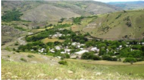
شکل ۳- وادی بند ارومیه و دره های سرسبز منطقه