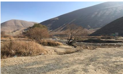
شکل ۵- وادی بند ارومیه و دره های سرسبز که جزو جاذبه های اکتوریستی این منطقه محسوب می شوند

مردم روستای بند اغلب کرد زبان هستند و شغل اصلی آن ها زراعت و دامداری است اما در طی سال های اخیر به دلیل افزایش گردشگران و مسافران در این منطقه، تعداد زیادی از این روستاییان برای ارائه ای خدمات به این گردشگران تغییر شغل داده و همین امر سبب شده که رستوران ها و غذا خوری های و مراکز رفاهی مختلف در تفرجگاه بند ساخته شوند. پیشرفت ساخت وساز در جنوب شهر ارومیه باعث شده که فاصله شهر ارومیه از تفرجگاه بند بسیار کم شود و همین امر سبب شده که مردم به این مکان تفریحی گرایش بیشتری داشته باشند.