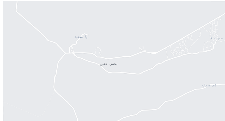
شکل ۲: جایگاه حوزه بخشی همگن کناری در رودان