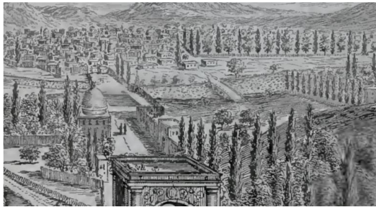
شکل ۱- خیابان چهارباغ و حوض وسیع آن به عرض خیابان و درختان منظم کاج و سرو خیابان چهارباغ و پلی بر رودخانه خشک مقابل دروازه باغ‌شاه (مأخذ: Daulier Deslandes: 1673)

این خیابان در اثر سیل‌های ویرانگر دوره صفویه که شرح آن قبلاً آمد به سرعت رو به ویرانی رفت تا آن‌جا که در زمان سلطنت شاه حسین صفوی مخروبه بود (Bembo, 2007: 306). عمارات سردر باغ‌ها دو به دو کاملاً مقابل هم و قرینه ساخته شده بودند که جلوه بی‌نظیری به خیابان می‌بخشید. بر فراز هر مدخل یک طاق نیم گنبدی و عمارتی کلاه فرنگی ساخته شده بود (افسر، ۱۳۵۳: ۱۵۴) که این عمارات سردر دو طبقه بودند و بر بالای هر یک گنبدی برافراشته شده بود (کریمی، ۱۳۲۷: ۲). این باغ‌ها از آب رکن آباد سیراب می‌شدند (افسر، ۱۳۵۳: ۱۶۵). ارتباط چهارباغ با بازار از آن جهت بود که این خیابان مستقیماً به بازار اصلی شهر از سوی دروازه اصفهان منتهی می‌شد.