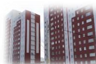
شکل شماره ۲: تصویری از مجتمع‌های مسکونی شهرک اندیشه