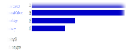
جدول ۹: ارزش وزنی مؤلفه های زیرساخت ها

اعداد جدول فوق نشان دهنده اولویت شاخص سطر نسبت به شاخص ستون مربوطه است. نمودار ۳ رتبه بندی و ارزش وزنی تعیین شده مؤلفه های زیرساخت ها را نشان می دهد. بنابراین، مؤلفه های زیرساخت ها به لحاظ ارجحیت (اهمیت) به قرار زیر می باشند.