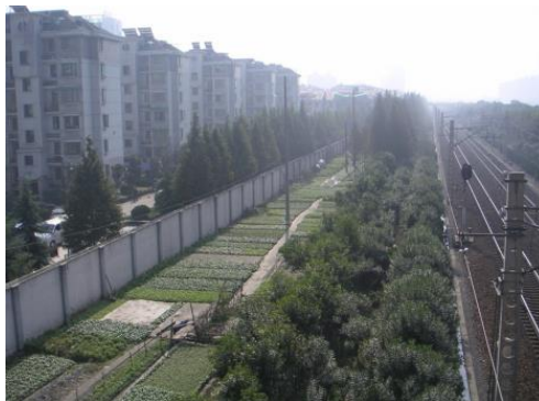
شکل ۳- مقاوم سازی فضای سبز شهری در هانگژو (Wolch et.al,2014:19 (ماخذ:)

به علاوه مطالعه های جدید نشان می‌دهد که تلاش هایی که برای سبزی سازی شهرها انجام شده است ممکن است موجب به آسیب به دارایی ها و ارزش عمومی شود و در نتیجه موجب طبقه سازی و از این رو جابجایی افراد کم در آمد شود. حتی تزئینات کوچک سبزی سازی در شهرها ممکن است موجب افزایش قیمت مال در هسته شهر شود که در این قسمت تراکم بالا بوده و مقدار پارک ها کم است و دما در بیشترین حالت قرار دارد. هانگژو از این رو ممکن است با مشکلات عدالت اجتماعی از نظر زیست محیطی و دسترسی به پارک ها رو به رو باشد. البته هنوز تلاش هایی برای ایجاد فضای سبز بیشتر، میتواند نتایج نامطلوبی را از نظر تناقض ایجاد فضای سبز در این شهر ایجاد کند (Wolch et.al,2014:17-18).