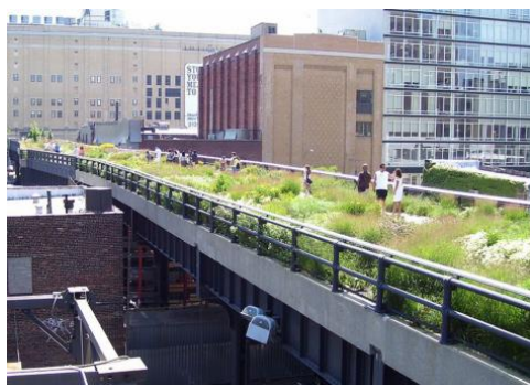
شکل ۴- خط بالا، خیابان بیستم، مرکز شهر، ۲۰۱۰، (ماخذ: Wolch et al, 2014: 18)

شهری به‌عنوان مثال در ایالات متحده در حال تلاش برای تبدیل کوچه‌های پشتی خیابان‌ها به زیر ساختارهای سبز برای پیاده روی و دوچرخه سواری و تمرین‌های معمولی و تعامل‌های اجتماعی هستند در حالی که با این کار توزیع فضای سبز شهری نیز بهبود پیدا می‌کند و به نوعی فواید فیلترسازی هوا و ایجاد زیست بوم نیز دیده می‌شود. این فضا‌های سبز خیلی فعالیت‌های بازسازی محسوسی را ایجاد نمی‌کنند اما می‌توان از آن‌ها با استفاده از وسایل بدن سازی، موجب افزایش فعالیت فیزیکی و مصرف انرژی در افراد شد. با این وجود دیگر روش‌های پایداری فضای شهری مانند برنامه‌های راهبردی ایجاد فضای سبز شهری ممکن است نتایج متناقض ایجاد کنند.