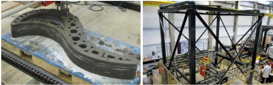
شکل ۳- سیستم چاپ بتن (در سمت چپ) و نیمکت چاپی (در سمت راست) (Lim, Buswell, Austin, Gibb, Thorpe, 2012)

تحقیق شرح داده شده در مقاله (Lim, Buswell, Austin, Gibb, Thorpe, 2012) از ماسه‌ای با حداکثر اندازه دانه ۲ میلی‌متر استفاده می‌کند. به عنوان اجزای اتصال از سیمان CEM I ۵,۵۲، خاکستر بادی و غبار سیلیس غیر فشرده استفاده شده است. برای اجزای خشک مخلوط آب به همراه فوق روان کننده مبتنی بر پلی کربوکسیلات برای افزایش کارایی و استحکام مواد اضافه و برای به دست آوردن زمان باز مناسب، کندکننده بر پایه آمینوتریس (متیلن فسفونیک اسید)، اسید سیتریک و فرمالدئید اضافه شده است. مطالعات نیز همچنین با استفاده از یک شتاب دهنده مبتنی بر سولفون‌ها، نمک‌های آلومینیوم و دی اتانول آمین انجام شده است. بتن همچنین حاوی میکروالیاف پلی پروپیلن به طول ۱۲ میلی‌متر و قطر ۱۸ میلی‌متر است که برای کاهش انقباض و تغییر شکل در حالت پلاستیک طراحی شده است. (Lim, Buswell, Austin, Gibb, Thorpe, 2012)