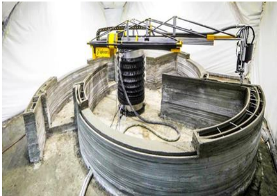
عکس ۱- فرآیند چاپ ارائه شده در فوریه ۲۰۱۷ در شهر استوپینو با چاپگر سه بعدی ساخت و ساز (Apis cor, 2018)

قابل تنظیم هستند، مانند تیکسوتروپی یا اسلامپ، زمان تنظیم در محدوده بسیار گسترده است، مقداری تا بالای ۱۸۰ دقیقه. بتن‌های ژئوپلیمر نشان دهنده مقاومت فشاری بالا، بیش از ۱۰۰ مگاپاسکال و مقاومت شیمیایی در قلیایی‌ها و اسیدها هستند. بر اساس یک چسب ژئوپلیمر، ترکیبات مختلف ژئو بتن توسعه و آزمایش که این آزمایش‌ها در ایرکوتسک روسیه انجام شد. D-Shape, 2018)