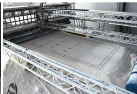
شکل ۲- چاپگر (D-Shape در سمت چپ) و شی چاپ شده - صخره مرجانی (در سمت راست) (D-Shape, 2018)

آزمون‌های پروژه (چاپ بتن) توسط دانشگاه لافورو (Lim, Buswell, Austin, Gibb, Thorpe, 2012) انجام می‌شود. نمونه اولیه دستگاه چاپ از قاب فولادی با ابعاد ۴.۵ متر طول، ۴.۴ متر عرض، ۴.۵ متر ارتفاع ساخته شده و سر چاپ بر روی نوار افقی متحرک نصب شده است. (شکل ۳) فرآیند چاپ را می‌توان در سه مرحله توصیف کرد: آماده سازی داده‌ها، آماده سازی مخلوط بتن و چاپ؛ مخلوط آماده شده در پمپ روی سکوی خارجی قرار می‌گیرد تا از طریق نازل چاپ با قطر ۹ میلی‌متر تغذیه شود. راه حل پیشنهادی مخزن بافر کوچکی را فراهم می‌کند که در بالای چاپگر قرار می‌گیرد. (Lim, Buswell, Austin, Gibb, Thorpe, 2012) در این پروژه از دو نوع متریال برای چاپ استفاده می‌شود. مواد مبتنی بر سیمان برای ساخت عناصر استفاده می‌شود، در حالی که مواد مبتنی بر گچ به عنوان ماده پشتیبانی برای عنصر چاپی عمل می‌کند. در این پروژه از مواد گچ به دلیل حذف آسان مواد، استحکام مکانیکی کم و بازیافت ۱۰۰٪ استفاده شده است. افزودنی‌های کندکننده به عنوان اجزای مخلوط اضافه می‌شوند تا زمان مورد نیاز را فراهم کنند و کارایی ثابتی از مواد در طول تولید به دست آورند. (Lim, Buswell, Austin, Gibb, Thorpe, 2012)