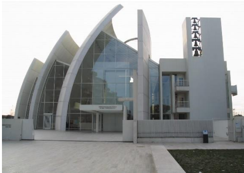
تصویر ۵: کلیسای ژوبیلی

میر بزرگترین مقلد لوکوربوزیه بود. ویژگی مشترک کارهای او تندیس‌گرایی در فضا است. از اولویت‌های طراحی او نور و فضا می‌باشد به طوری که فضاهایی که با نور و مقیاس انسانی تعریف شده‌اند را برتر از فضاهای گنگ و بدون مقیاس می‌داند. ریچارد میر پس از کسب جایزه پریترکر به عنوان جوان‌ترین معمار برنده این مسابقه، خود را به همگان اثبات کرد. پس از کسب این جایزه، پروژه‌های مهمی به وی واگذار شد که می‌توان مهم‌ترین آن‌ها را مرکز گتی لس‌آنجلس دانست. (کامل‌نیا، مهدوی‌نژاد، ۱۳۹۵). میر در تحلیل‌هایش همیشه بر پنج عامل مهم تاکید داشت: برنامه، محوطه، ورودی، سیرکوالسیون و سازه. (توکلی دارستانی، ۱۳۹۳). ریچارد میر اندیشه‌های خود را وامدار معماران مدرن بزرگی چون لوکوربوزیه دانسته و می‌گوید: «این روزها معماران را چنین قلمداد می‌کنند: پست مدرنیسم، مدرنیسم، نئومدرنیسم و دیکانستراکتیویسم. من ترجیح می‌دهم از تمام این‌ها که تمرکز مرا در هر جا از واقعیت و مسائل مربوط به معماری امروز برهم می‌زند، دوری کنم. بی تردید امروزه تمام فعالیت معماران تحت تأثیر مدرن‌گرایی لوکوربوزیه، آلتو، ون د روهه و گروپوس است و ظاهراً من استثنا نیستم.» (بالزر، ۱۳۸۵). او در تعریف اصول معماری خود می‌گوید: «معماری من، توجه به فضا است؛ البته فضایی دارای نظم و با در نظر گرفتن نور، معیارهای انسانی و فرهنگ معماری، نه فضایی بی‌تناسب. دغدغه اصلی من، ساخت فضا، دست بردن