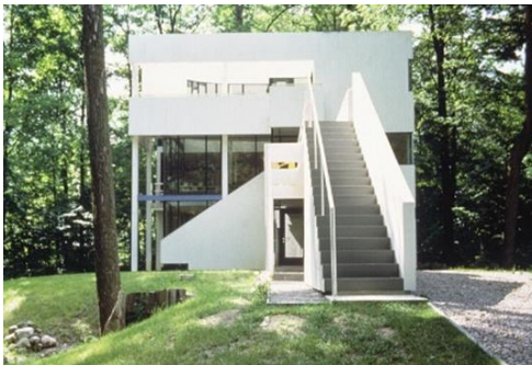
تصویر ۲- خانه هانسلمن

از آثار این معمار در سبک پست مدرن سفید است، به نظر می‌رسد که این خانه از دید پرنده، یک الماس درخشان در طبیعت است. ساختمانی سفید به مانند ساختمان‌های مدرن و در عین حال انسان محور که آن را تبدیل به پست مدرن می‌کند. کارفرما در این پروژه سه نیاز داشته است: ۱- بالکن سراسری ۲- ورود و خروج به خانه در سایه صورت گیرد. ۳- طبقه‌ی اول دارای یک ورودی مجزا باشد. (سرداری، ۱۴۰۰)