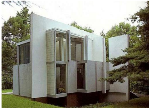
تصویر ۱- خانه شماره شش (مأخذ: Archdaily, ۲۰۱۰)

اولین دوره آثار آیزنمن به عنوان معماری مقوایی شناخته می‌شود که آثار پست مدرن سفید او نیز در همین دوره قرار گرفته و با همین فلسفه پیش رفته است. آثار مهم او در این دوره خانه های ۱ تا ۱۰ است که از مشهورترین آن‌ها، می‌توان خانه شماره ۶ را نام برد. (تصویر شماره ۱).