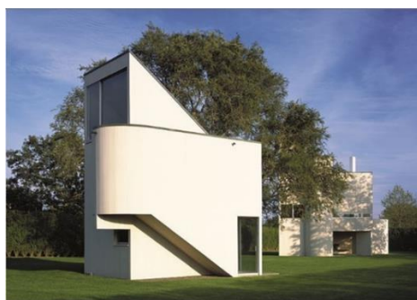
تصویر ۳- استودیو گواتمی

آثار چارلز گواتمی به لحاظ ویژگی‌های ساختی متأثر از میس وندروهه بود و می‌توان گرایشات تندیس‌گراییانه را در آثارش مشاهده نمود. (کامل نیا، مهدوی نژاد، ۱۳۹۵). از آثار مهم چارلز گواتمی می‌توان به سکونت‌گاه بریج همپتن و خانه و استودیو گواتمی (تصویر شماره ۳) اشاره کرد. گواتمی در سال ۱۹۶۵ زمانی که هنوز یک معمار تازه‌کار بود دست به طراحی خانه و استودیو برای والدینش زد. این خانه در سایتی