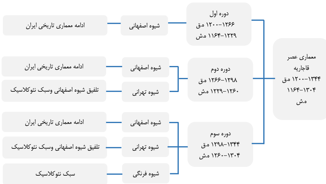
نمودار ۱: دوره بندی شیوه های معماری در عصر قاجار (ماخذ: قبادیان ۱۴۰۰، ۲۵)

خاندان قاجاریه از سال ۱۱۵۸ الی ۱۳۰۴ (ه.ش) یعنی مجموعاً ۱۴۶ سال در ایران سلطنت کردند. در طی این مدت تحولات بسیار زیادی در شئون مختلف مملکت صورت گرفت. معماری این دوره حدوداً ۱۵۰ قرن را شامل می شود. که سراسر فرازونشیب و تغییرات و تحولات است. اما به طور کلی به سه دوره کلی تقسیم شده است و طی بررسی این سه دوره نحوه ورود فرهنگ غرب به ایران به گونه ای واضح جلوه گر می شود.