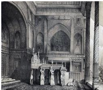
تصویر ۲: اثر اوژن فلاندن از نمای درونی تخت مرمر

در طرح هانریش بروگش از آن ساختمان در سال ۱۲۷۷ ه.ق (۱۲۴۰ ه.ش) نیز کماکان هویت تاریخی بنا حفظ شده است. (ذکا ۱۳۶۹). اولین تصویری که در آن نمادهای معماری غرب در این ساختمان مشهود است، مربوط به سال ۱۳۰۰ ه.ق است که توسط ابوتراب غفاری در روزنامه شرف نمره دوازدهم کشیده شده است. در این تصویر ناصرالدین شاه بر روی تخت مرمر نشسته و قوس‌های دو طرف ایوان به صورت قوس‌های نیم‌دایره درآمده‌اند. بر بالای ساختمان هم به جای یک بام، سه بام شیب‌دار قرار دارد. یک بام شیب‌دار بر روی ایوان و دو بام شیب‌دار در دو طرف آن احداث شده است. دیوار حیاط در دو طرف ساختمان نیز برچیده گردیده است. در تصاویر بعد از این تاریخ تا زمان حاضر، کماکان همین وضعیت ساختمان حفظ شده است. تنها تفاوت عمده این است که سه بام شیب‌دار بر روی بام به یک بام شیب‌دار سرتاسری تبدیل گردیده است. (همان ۱۰۲). لذا می‌توان گفت که پلان، نما، مقطع و کلیات طرح این ساختمان بر طبق ضوابط معماری تاریخی ایران و شیوه‌هایی که در دوره‌های صفویه و زندیه متداول بوده (شیوه اصفهانی) احداث و تکمیل شده است. در پلان ساختمان هیچ تغییری صورت نگرفته و به همان شکل گذشته تا به امروز باقی مانده است. نماها و نمادهای این عمارت تا سال ۱۳۰۰ ه.ق کماکان در چهارچوب شیوه فوق باقی بوده است. (قبادیان ۱۴۰۰: ۳۱)