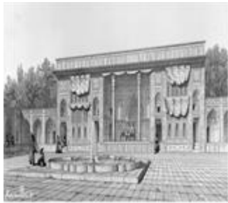
تصویر ۱: اثر پاسکال کست از تخت مرمر عمارت دیوانخانه

نیز به صورت قوس جناغی می‌باشد. ژول لورنس در دومین سال سلطنت ناصرالدین شاه (۱۲۶۵ ه.ق) تصویری از داخل ایوان کشیده، که در آن مجدداً به جز نقاشی‌های واقع‌گرا بر روی بدنه دیوارهای ایوان، سایر قسمت‌ها کاملاً سنتی می‌باشد.