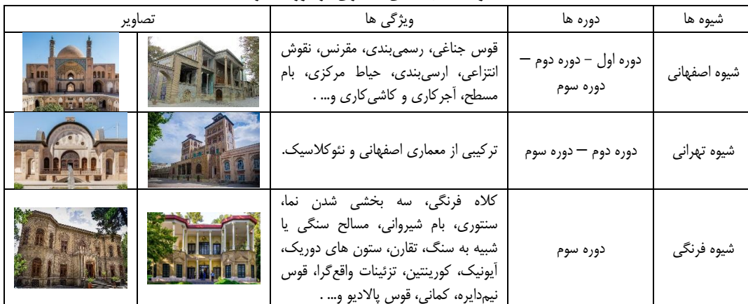
جدول ۴: سبک‌های معماری در دوره قاجار

معماری در دوره قاجار در مقایسه با خلاقیت فضایی جایگاه برتر و تکامل یافته‌تری نسبت به معماری دوره‌های قبل خود دارد چرا که تنوع فضاها و خلق و ایجاد فضای نوین در این دوره به چشم می‌خورد. به طور خلاصه اگر تکامل معماری را گشایش و شفافیت فضا بدانیم، معماری دوره قاجار به عنوان مرحله تکامل یافته معماری قدیم ایران مطرح می‌شود. همچنین معماری دوره قاجار به نسبت تناسبات و تزئینات و اندازه‌ها وضع نازل‌تری در قیاس با دوره‌های گذشته خود دارد.