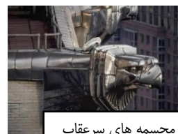
مجسمه های سرعقاب