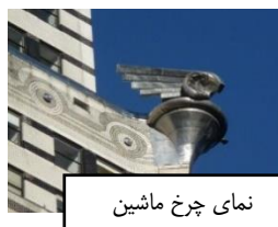
نمای چرخ ماشین