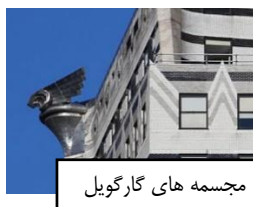
مجسمه های گارگویل