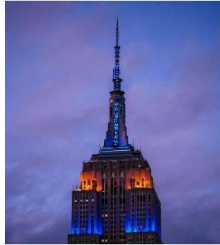
شکل ۵- ساختمان امپایراستیت

تزیینات نمای این ساختمان عمدتاً به صورت هندسی می‌باشد. پنجره‌های فولادی در نمای این برج و ارتباط شگفت‌انگیز آنها با یکدیگر سبب شده است تا این برج نمایی شگفت‌انگیز را به خود اختصاص دهد. وجود مجسمه های عقاب در ورودی این برج احساس قدرت و شکوه را به شهر القا میکند. به دلیل اهمیت این برج مطابق با رویدادهای فرهنگی و اجتماعی متنوع این برج نورپردازی میشود.