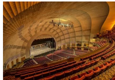
شکل ۷- ساختمان رادیو سیتی، نیویورک منهتن