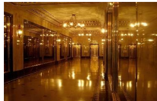
شکل ۲- لابی ساختمان بریل ۲ ، آمریکا