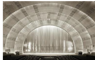
شکل ۱- ساختمان رادیو سیتی، نیویورک منهن