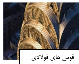
قوس های فولادی