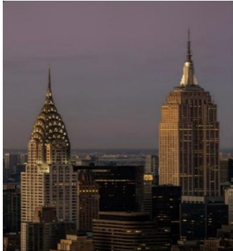
شکل ۶- برج امپایراستیت و کرایسلر، منهتن

شکل ۶). برج امپایراستیت اولین ساختمان در جهان بود که بیش از صد طبقه ارتفاع داشته است، اگرچه تنها تا طبقه ۸۶ قابل استفاده می‌باشد. از اولین طبقه تا ۸۶ امین طبقه این برج کاربری اداری-تجاری دارد و در نهایت در طبقه ۸۶ امپایراستیت، رصدخانه وجود دارد. امپایراستیت به دلیل زمین بزرگ و پایه‌های نسبتاً کوتاه‌اش دارای توده‌ای متقارن است. این ساختمان از سه بخش پایه، شفت و سرستون تشکیل شده است (Donald Reynolds, 1999).