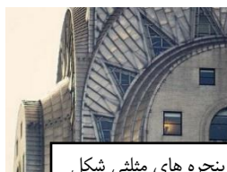
پنجره های مثلثی شکل