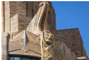
شکل ۳- ساختمان جنرال الکتریک ۳ ، نیویورک منهن

در این سبک تزئینات از رکن‌های اصلی به حساب می‌آید. فرم‌های هندسی ساده شده، نگاره‌های طبیعت، نمادهایی از ماشین، سرعت و توصیف‌های تمثیلی و استعاری، داشتن سقف هموار، چارچوب فلزی پنجره‌ها، علامت‌ها یا مارک‌هایی با شکل‌های مخصوص و تزئین شده برخی از ویژگی‌های سبک آرت دکو در معماری داخلی بناها می‌باشد (ایرجی، ۱۳۸۷). در ساختمان‌های کوتاه مرتبه این سبک، تاکید بر خطوط افقی ممتد (استریم لاین ۱ ) و در مواردی، احداث یک برج مرتفع در میان ساختمان بود. بالای برج غالباً به صورت پله ای طراحی می‌شد. تزئینات جذاب و براق با استفاده از خطوط انحنا دار و نرم و یا خطوط زیگراگ مانند و به کارگیری رنگ‌های روشن و اولیه و لامپ‌های نئون از ویژگی های این سبک محسوب می‌شد (قبادیان، ۱۳۹۲) (شکل ۱). سبک آرت دکو برای ساختمان‌های بلندمرتبه نیز مورد توجه بود. در ساختمان‌های بلندمرتبه، تاکید بر خطوط عمودی بوده است (کرتیس، ۱۳۸۲). در سبک آرت دکو، از فرم‌های زیگراگ، پله ای، دایره آفتاب و قوس‌های بلند نیز زیاد استفاده می‌کردند (شکل ۲). دیواره‌های داخلی بناهای آرت دکو و گاه سقف آن‌ها دارای نقوش هندسی یا گلدار بوده و راه‌پله‌ها خوش‌قواره و نرده‌ها عموماً فلزی بوده اند (شکل ۳). یکی از رایج‌ترین مصالح به‌کاررفته در این سبک موزائیک مرمرات که از کنارهم چیدن سنگ‌های رنگی و جلابخشیدن به سطح آن، به دست می‌آید. همچنین مرمر و کاشی نیز به‌صورت گسترده در کف بنا به کار می‌رود (ایرجی، ۱۳۸۷).