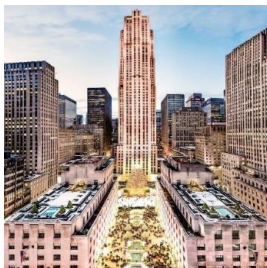
شکل ۸- مرکز راکفلر، نیویورک منهتن

علاوه بر برج‌های مرتفع، سبک آرت دکو برای سینماها، سالن‌های نمایش و هتل‌های تفریحی مورد استفاده قرار گرفت. تالار موسیقی رادیوسیتی ۱ (۱۹۳۳) با گنجایش ۶۰۰۰ نفر در نیویورک، جزو یکی از زیباترین تالارها در این سبک است (شکل ۷). فضای داخلی آن توسط دونالد دسکی ۲ و بدنه خارجی آن توسط ادوارد دورل ستون ۳ طراحی شده است (قبادیان، ۱۴۰۲). مرکز راکفلر ۴ یک محوطه تجاری بزرگ است که با حجم‌های سنگی، مجسمه‌های تمثیلی و چندرنگ پیکره‌های طلاکاری شده آن را تشکیل داده اند. تالار موسیقی رادیو سیتی در این مجموعه واقع شده است. (پاتریشا بایر، ۱۹۹۲) (شکل ۸)