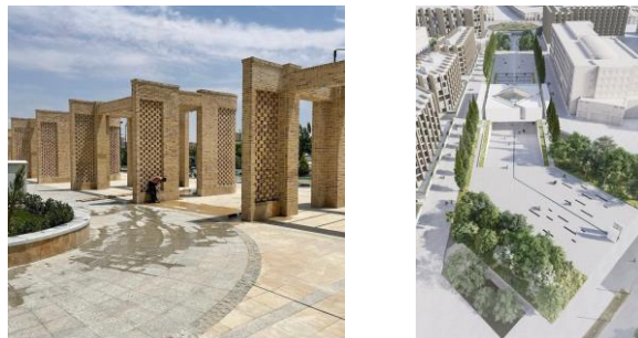
شکل ۲- ره باغ جنان (ماخذ: نگارنده)

کیفیت بصری محیط نقش مهمی در افزایش جذابیت زیبایی شناختی و درک کلی فضاهای داخلی و شهری دارد. تحقیقات نشان می دهد که کیفیت بصری تحت تأثیر عواملی مانند طراحی نور، رنگارنگی، پیچیدگی و وضوح محیط قرار می گیرد (Zanon et al, 2019). آلودگی بصری در مناطق شهری می تواند به طور قابل توجهی بر کیفیت زندگی ساکنان تأثیر بگذارد و اهمیت ارزیابی و بهبود محیط های بصری را برجسته می کند. کیفیت بصری محیط یک جنبه حیاتی از تجربه انسان است که بر خلق و خو، رفتار و رفاه کلی ما تأثیر می گذارد. باغ ها با کاهش آلودگی بصری، ایجاد حس آرامش و ایجاد یک منطقه حائل طبیعی می توانند کیفیت بصری محیط را به میزان قابل توجهی بهبود بخشند. مطالعه ای که در ژاپن انجام شد نشان داد که باغ هایی با سطح بالای پوشش گیاهی با کاهش سطح استرس و بهبود خلق و خوی مرتبط هستند (کاپلان، ۱۹۹۵). ادغام موثر عناصر بصری می تواند فضاهای شهری را متحول کند و آنها را هماهنگ تر و جذاب تر کند و در عین حال محرک های منفی را به حداقل برساند. علاوه بر این، استفاده از رنگ در پوشش گیاهی می تواند به ارزش زیبایی شناختی محیط های بیرونی کمک کند، و بر اهمیت اجزای بصری در شکل دهی به محیط اطراف ما تأکید بیشتری دارد. به طور کلی، درک و افزایش کیفیت بصری برای ایجاد محیط های بصری دلپذیر و راحت برای افراد در محیط های داخلی و خارجی ضروری است.