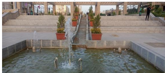
شکل ۴- آب‌نما، فضای انبساط ذهن

در مسیرهای ره باغ‌فضاهای تعبیه شده جهت توقف کوتاه مدت و فراغت در نزدیکی هم و به موازات هم به فرار و رهایی ذهن از موقعیت شلوغ شهری و رهایی از خستگی کمک کند. بنابراین ایجاد نظر به عنوان یک قابلیت رهایی‌بخش کمک موثری در رفع خستگی ذهن دارد. نگاه توأم با مکث به منظر می‌تواند رهایی بخش بوده و زمینه انبساط خاطر ایجاد کند.