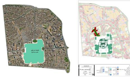
شکل ۱- مسیر های ره باغ منتهی به حرم

که در جهت رفاه حال زائرین پیش بینی شده اند، شامل ره باغ حضرت زهرا(س)، ره باغ طویبی، ره باغ بهشت، ره باغ جنان و ره باغ رضوان و چند ره باغ دیگر می باشد.