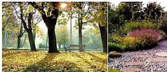
شکل ۳- ایجاد منظر جذاب در فضا

محیط طبیعی نقش بسیار غیرمنتظره و موثری در فرایند توسعه وضوح ذهنی دارد (Kaplan, ۱۹۷۷). وضوح ذهنی نیز یکی از موثرترین عامل در تکامل اعتماد به نفس و استقلال محسوب می‌شود. بهره‌برداری از فضای سبز در قالب مکان و چشم‌انداز، به دانش‌آموزان اجازه می‌دهد تا حس حضور در یک مکان امن را داشته باشند (ماهوتی و موسوی، ۱۳۹۸). تأثیر بصری عناصر جذاب در منظر به سرعت جایگزین تأثیر خسته‌کننده عناصر قبلی در ذهن شده و آن را از استهالک و خستگی بیشتر نجات داده، بازسازی کرده و تمرکز تازه ایجاد می‌کند. تماشای لغزش و ریزش برگ‌های رنگارنگ درختان پاییزی، شنیدن و دیدن صدا و حرکت پرندها روی شاخه‌ها، بازیهای آب و نور به همراه تغییر رنگ آنها در روزها و فصل‌های چهارگونه، استفاده از تندیس و مجسمه در بستر طبیعی منظر، همه از جذابیت‌های ذهن‌نواز منظر است که به راحتی در پیرامون و درون فضاهای بسته معماری قابل گسترش است.