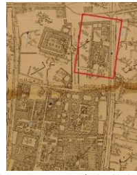
شکل ۲- نقشه دارالخلافة ناصری تهران- عبدالغفار نجم‌الملک

مدرسه جدید (مدرسه موسیقی) متشکل بوده است از یک میان‌سرای مستطیل شکل با اتاق‌هایی در دو جناح شمالی و جنوبی. دیوار شرقی مدرسه دیوار ساده‌ای است در جوار بنای تلگرافخانه. دیوار غربی آن نیز دیوار ساده طاق نماداری است در جوار کوچه‌ای شمالی-جنوبی که از غرب مدرسه می‌گذرد. جناح جنوبی مدرسه، در جوار مدرسه قدیم، دو طبقه است با خورشیدی‌هایی چند پر که رخ بام را می‌آراید. دالانی با دهانه ایوان مانند و قوس گرد، در وسط جبهه جنوبی مکان پلکانی است که به طبقه بالا راه می‌برد. اتاق‌های فوقانی این جبهه رو به بام مدرسه قدیم پنجره دارد و از آنجا می‌توان بام و برج ساعت و چتر درختان حیاط قدیم را دید. نمای دو طبقه و مفصل جبهه جنوبی ایوان ستون‌داری است که از میانه جبهه شمالی بیرون زده و آن را تشخیص بخشیده است. همه نماها گچ اندود با قاب‌بندی آجری است. برخی از این قاب‌ها، در جبهه شمالی، آجرکاری دندانه‌ای دارد که متأثر از معماری اروپاست. شکل ۴ و ۵ نشانگر جبهه جنوبی و جبهه شمالی مدرسه است. درها و پنجره‌ها دارای قوس هلالی و چهارچوب چوبی و شیشه‌های مربع است. (قیومی بیدندی، ۱۳۹۷: ۱۲۵)