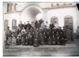
شکل ۴- جبهه جنوبی حیاط مدرسه جدید