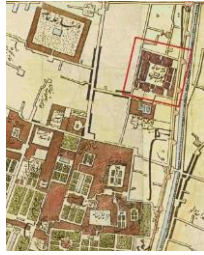
شکل ۳- نقشه دارالخلافة طهران- آگوست کارل کرشیش (مأخذ: پایگاه نگارستان، ۱۲۷۵ هـ. ق.)