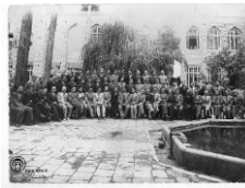
شکل ۷- بنای ثانویه-حیاط مدرسه دارالفنون

البرز نیست، کلیه قوس‌ها به صورت جناغی اجرا شده تزئینات به صورت کاشی‌های هفت‌رنگ با طرح‌های اسلیمی و گره‌چینی است. قطار بندی‌ها به صورت سرتاسری بر بالای دیوارهای اطراف حیاط و همچنین سردر ورودی انجام شده. سرستون‌ها به صورت مقرنس و مشابه ستون‌های صفوی است. در این مرکز علوم جدید دیوارها آجری و برابر هستند بام آن شیبدار و با پوشش شیروانی است. (شکل ۶ و ۷) نکته جالب توجه آنکه طرح اولیه مدرسه دارالفنون که توسط میرزا رضا مهندس‌باشی انجام شده بود تحت تأثیر معماری نئوکلاسیک غرب قرار داشت ولی پس از هفتاد سال نیکلای مارکف روس طرح نماهای این مدرسه را به شیوه اصفهانی و برطبق سنت معماری ایران طراحی و بازسازی نمود. در اینجا لازم به ذکر است که ورودی سمت شرقی مدرسه از سمت خیابان ناصرخسرو در سال ۱۲۹۲ خورشیدی ساخته شده بود که در طرح مارکف همین مسیر به عنوان ورودی اصلی مدرسه ابقا شد. این ورودی نیز کاملاً به سبک سنت‌گرایی است. (قبادیان، ۱۳۹۲: ۱۴۵-۱۴۶)