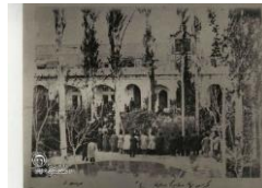
شکل ۶- بنای اولیه-حیاط مدرسه دارالفنون