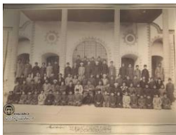
شکل ۵- جبهه شمالی حیاط مدرسه جدید

مدرسه جدید (مدرسه موسیقی) متشکل بوده است از یک میان‌سرای مستطیل شکل با اتاق‌هایی در دو جناح شمالی و جنوبی. دیوار شرقی مدرسه دیوار ساده‌ای است در جوار بنای تلگرافخانه. دیوار غربی آن نیز دیوار ساده طاق نماداری است در جوار کوچه‌ای شمالی-جنوبی که از غرب مدرسه می‌گذرد. جناح جنوبی مدرسه، در جوار مدرسه قدیم، دو طبقه است با خورشیدی‌هایی چند پر که رخ بام را می‌آراید. دالانی با دهانه ایوان مانند و قوس گرد، در وسط جبهه جنوبی مکان پلکانی است که به طبقه بالا راه می‌برد. اتاق‌های فوقانی این جبهه رو به بام مدرسه قدیم پنجره دارد و از آنجا می‌توان بام و برج ساعت و چتر درختان حیاط قدیم را دید. نمای دو طبقه و مفصل جبهه جنوبی ایوان ستون‌داری است که از میانه جبهه شمالی بیرون زده و آن را تشخیص بخشیده است. همه نماها گچ اندود با قاب‌بندی آجری است. برخی از این قاب‌ها، در جبهه شمالی، آجرکاری دندانه‌ای دارد که متأثر از معماری اروپاست. شکل ۴ و ۵ نشانگر جبهه جنوبی و جبهه شمالی مدرسه است. درها و پنجره‌ها دارای قوس هلالی و چهارچوب چوبی و شیشه‌های مربع است. (قیومی بیدندی، ۱۳۹۷: ۱۲۵)