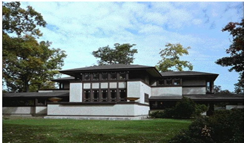
تصویر (۱۶): خانه ویلیتس اثر فرانک لوید رایت

خانه ویلیتس ۵ در هایلند پارک ایلی نویز ۶ ، یک نمونه بارز از نوع خانه مرغزاری است که در ۱۹۰۲ میلادی ساخته شد. پلان صلیبی شکل آن به دور یک بخاری دیواری (شومینه) که در مرکز بنا مستقر شده، شکل گرفته است. در حالی که هر یک از فضاها شخصیت مستقل فردی خود را دارند، اما آزادانه با سایر فضاها تداخل پیدا می‌کنند و نوعی تداوم زنده را پدید می‌آورند. دو بال غیر متقارن بنا همچون دو بازوی گشاده به درون پارک پیرامونی ساختمان نفوذ کرده‌اند، پارکی که مرغزار آن تالبه دیوارهای ساختمان ادامه دارد. به این ترتیب خانه و طبیعت، طبق نظام محور مشخص، در یکدیگر ادغام شده‌اند. این ادغام به کمک بام‌های کم شیب که به طور مشخص از نما بیرون زده‌اند و تأکید بر عناصر افقی نما و استفاده از مصالح طبیعی که با محیط ممزوج می‌شوند، بیشتر مورد تأکید قرار گرفته است.