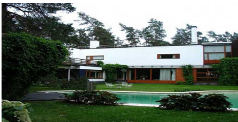
تصویر (۸): ویلا مایرا اثر آلوار آلتو

در اوایل سال ۱۹۳۸ میلادی، زمانی که خانه آبشار اثر فرانک لویید رایت تازه شهرت یافته بود آلوار آلتو برای ساخت مجدد ویلا مایرا ۲ از ان الهام گرفت. حتی گفته آلتو پس از آشنایی با پروژه رایت از مشتریان خود خواست که ویلا را بر روی نهری که در اراضی آنها واقع بود بنا کنند. تأثیر خانه آبشار بر پروژه آلتو در اجزایی مانند تراس‌های بیرون زده جسورانه و طبقه زیرزمین که در معماری آن از فرم موج نهر و صخره‌ها الهام گرفته شده کاملاً آشکار است. ویلا مایرا نیز همچون خانه آبشار رایت، از طبیعت الهام گرفت و در دل طبیعت نیز ساخته شد و یکی دیگر از بناهای سبک معماری ارگانیک محسوب می‌شود.