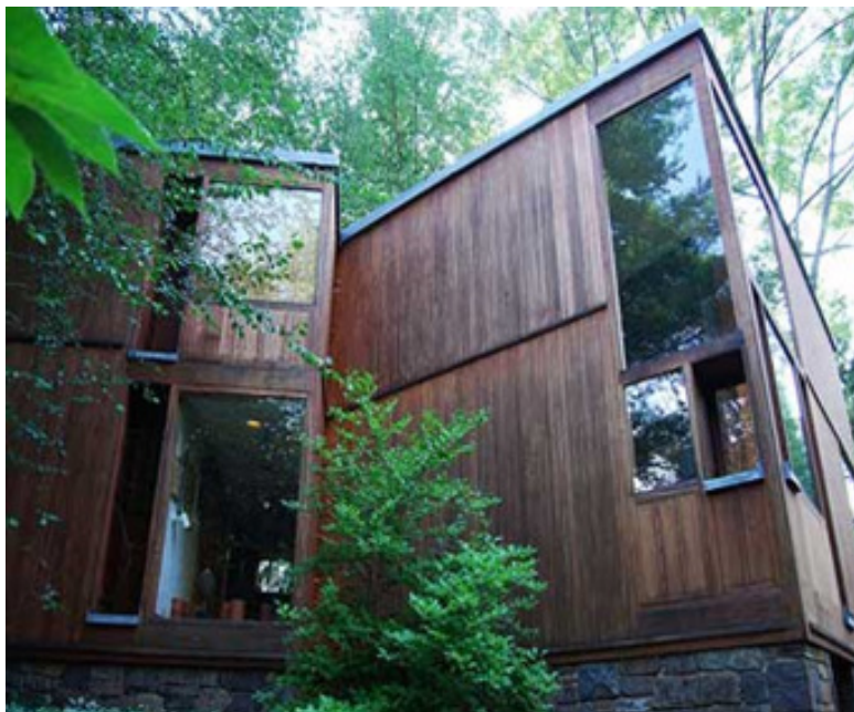
تصویر (۷): توجه لوئی کان به استفاده از نور طبیعی در بنا

در قبال سازندگی آدمی در تمام زمانها، زیبا و منطقی بود. این اندیشه که گذشته در حال حاضر ریشه دارد و پژوهش به دنبال حقیقت در جمله‌ای موجز و شاعرانه از خود کان مستتر است: آینده همان امروز است.