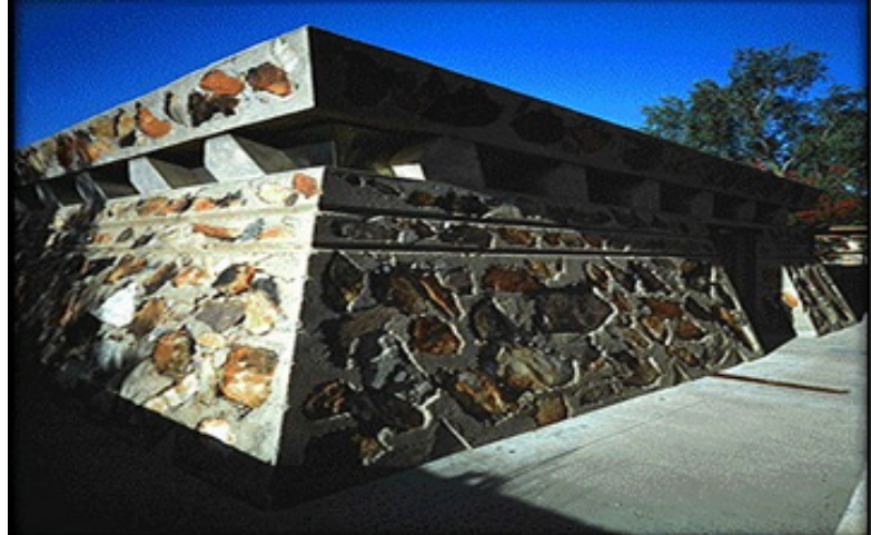
تصویر (۱۵): تالیسین غربی اثر فرانک لوید رایت

رایت در سال ۱۹۳۸ میلادی تالیسین غربی ۱ را به عنوان خانه زمستانی اش در صحرای پارادایزولی ۲ در نزدیکی فونیکس آریزونا ۳ بنا کرد. او برای آفرینش یک قطعه مصنوع از طبیعت، از سنگ آهک محلی و چوب در ترکیب‌های مورب و زاویه دار استفاده کرد و نیز قواعد هندسی ترکیب بندی را که قبلا در مجموعه کویری اکاتیلو ۴ تجربه کرده بود، به کار بست. دیواره‌های تنومند پی‌ها و سازه قابل رؤیت الواری و بام‌های خیمه‌گون، موجب برقراری رابطه خانه با طبیعت روستایی پیرامون می‌شدند و به همین ترتیب داخل و خارج بنا را با هم مرتبط می‌ساختند کل این مجموعه به صورت یک محوطه ساختمانی ناتمام معماری در یک حالت تولد ابدی باقی ماند.