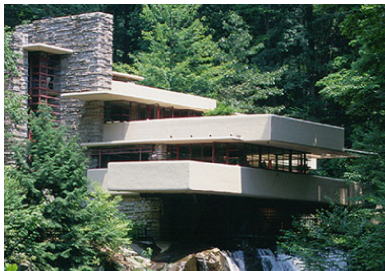
تصویر (۱۲): خانه آبشار اثر فرانک لویید رایت

در مرکز بنا و بر یک تخته سنگ قرار گرفته است و همانند سایر عناصر باربر عمودی این بنا، کلا از سنگ‌های طبیعی ساخته شده است. متکی بر این دیوارهای قائم سنگی، سقف‌های یکپارچه از بتن نرم با اشکال مستطیلی در سطوح مختلف یکی بر فراز دیگری قرار گرفته‌اند که همگی به نوعی به سوی محیط پیرامون پیش‌رفتگی دارند، اما برفراز دره باریک موجود، نقش یک پل را بازی می‌کنند. پلان صلیبی شکل این بنا در سه بعد گسترش یافته است و کاملاً از اجمال‌گرایی آزاد است به طوری که یک سلسله مراتب زنده و پیچیده از تداوم و تداخل فضایی را به وجود می‌آورد، یعنی استفاده بنیادی و افراطی از امکانات ساختمانی بتن مسلح بدون اینکه به موضوع تزئین امتیازی خاص اعطا کند. موضوع همجواری فضای داخلی و محیط اطراف به کمک عناصر واسطه‌ای که دارای خاصیت نافذی هستند حل شده است، یک عمل شاعرانه که در عین حال هرگز تسلیم رمانتیک‌گرایی یا تقلید بی‌محتوا از طبیعت نمی‌شود.