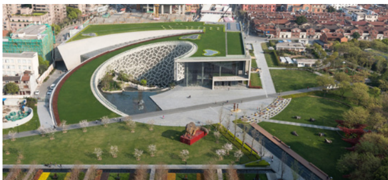
تصویر (۶): تغییر چهره طبیعت به دست انسان

لوئی سالیوان از پایه‌گذاران مکتب شیکاگو و معماری مدرن در آمریکا بود. وی اعتقاد بسیار زیادی به فرم‌های طبیعی و سبک ارگانیکی داشت. سالیوان به روشی معتقد بود که مشابه پروسه به وجود آوردن در طبیعت بود. او برای اولین بار اصطلاح "فرم تابع عملکرد" ۲ را بیان نمود. یعنی سالیوان فرم تابع عملکرد را در پروسه رشد و حرکت طبیعی می‌دید. به عقیده سالیوان، سنگ و ملات در ساختمان ارگانیکی زنده می‌شود. موضوعی که فرانک لویید رایت شاگرد وی بهتر از هر معمار معاصر دیگری آن را در ساختمان‌هایش نشان داده است. رایت اگر چه با تکنولوژی مدرن مخالفتی نداشت ولی وی آن را به عنوان غایت و هدف تلقی نمی‌نمود. به اعتقاد رایت تکنولوژی وسیله‌ای است برای رسیدن به یک معماری والاتر که از نظری همانا معماری ارگانیکی بود.