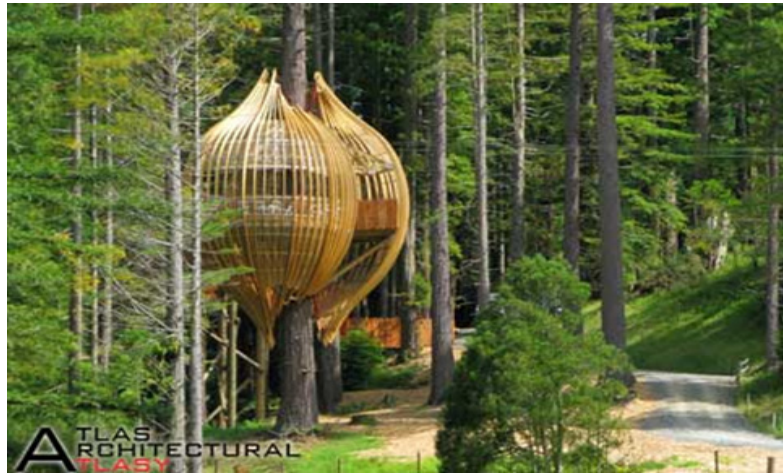
تصویر (۴): استفاده از عناصر طبیعت برای ساخت

بلکه از پیش در خود مصالح وجود دارد. بنابراین هنرمند همواره در کشاکش متافیزیکی با فرم و اسرار طبیعت است و این فرآیندی است مکاشفه‌آمیز که از طریق آن هنرمند توده فرمی را که از قبل در ذهن خود و نیز در مصالح نهفته است، کشف می‌کند. شاید این همان موضوعی باشد که فرانک لویدرایت همواره در بحث مصالح به آن اشاره می‌کند. با آنکه رایت به طبیعت عشق می‌ورزد، شاید هیچ‌گاه نتوانست مانند میکل آنژ به سرشت خارق العاده مصالح دست یابد. رایت و بسیاری از معماران که در طلب یادگیری از طبیعت هستند بسیاری از اسرار طبیعت، جنبه‌های مختلف آمیختن طبیعت با سایت، استقرار ساختمان روی آن، جهت یابی آن، آثار جنبی حرارتی و اقلیمی و گاه حتی جنبه‌های مختلف فرمی طرزتشکیل ساختمانی طبیعت را فرا گرفته‌اند.