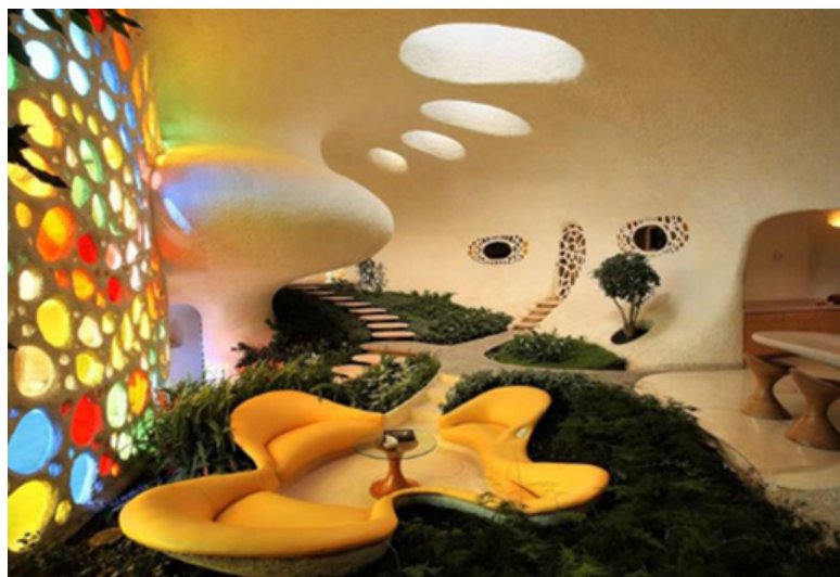
تصویر (۲): الهام‌گیری از طبیعت