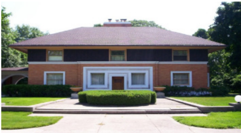
تصویر (۱۸): خانه وینسلو اثر فرانک لوید رایت

رایت در سال ۱۸۹۴ میلادی خانه وینسلو ۳ را در ریور فاست ۴ در ایلی نویز طراحی کرد که در آن برای نخستین بار، جنبه‌های ویژه سبک رایت - بام‌های بیرون زده، تأکید بر خطوط افقی و نمای غیرمتمقارن - مشاهده می‌شوند. به این ترتیب معمار جوان، نخستین نمونه از مجموعه خانه مرغزاری را بنا کرد، یک نمونه جدید از خانه‌هایی مبتنی بر استقرار آزاد در یک محوطه طبیعی که وجه مشخصه آن سادگی قابل ملاحظه، نفی فضاهای نمایشی و غیرمورد استفاده و پلان آزاد بود که همگی جنبه‌هایی مبتنی بر اصول خانه‌های روستایی آمریکایی بود.