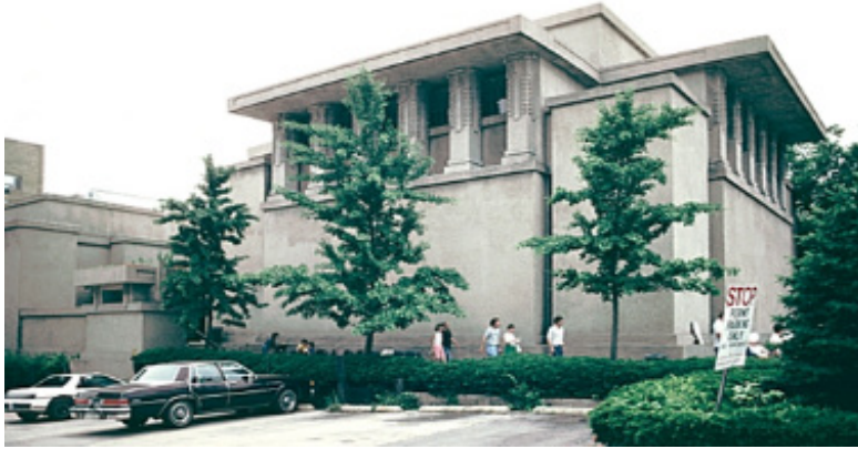
تصویر (۱۷): معبد وحدت اثر فرانک لوید رایت

رایت در سال ۱۸۹۴ میلادی خانه وینسلو ۳ را در ریور فاست ۴ در ایلی نویز طراحی کرد که در آن برای نخستین بار، جنبه‌های ویژه سبک رایت - بام‌های بیرون زده، تأکید بر خطوط افقی و نمای غیرمتمقارن - مشاهده می‌شوند. به این ترتیب معمار جوان، نخستین نمونه از مجموعه خانه مرغزاری را بنا کرد، یک نمونه جدید از خانه‌هایی مبتنی بر استقرار آزاد در یک محوطه طبیعی که وجه مشخصه آن سادگی قابل ملاحظه، نفی فضاهای نمایشی و غیرمورد استفاده و پلان آزاد بود که همگی جنبه‌هایی مبتنی بر اصول خانه‌های روستایی آمریکایی بود.