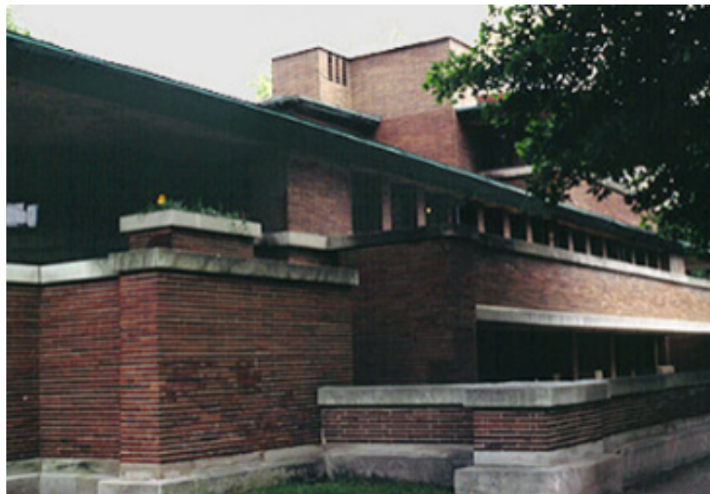
تصویر (۱۰): خانه روبی اثر فرانک لویید رایت