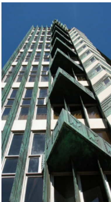
تصویر (۲۱): برج پرایس اثر فرانک لویید رایت

بین سالهای ۵۶-۱۹۵۳ میلادی، رایت برج پرایس را در بارتلس ویل اوکلاهاما بنا کرد. ساختمان ۱۹ طبقه، شامل آپارتمان‌های مسکونی و اداری که گرچه با پروژه‌های ساختمان‌های مرتفع قبلی بی‌ارتباط نیست، اما در عین حال یک تعریف فرمال جدید از آسمان خراش را ارائه می‌دهد. پلان‌های آزاد روی هم قرار گرفته‌اند و همگی نسبت به یک هسته مرکزی در حالت تعلیق اند. قطعات نما پیش‌ساخته بودند، در حالی که روکش‌های مسی نما که در حد فاصل پنجره‌های طبقات قرار داشتند، دارای تزیینات برجسته‌ای بودند که روی آنها به طریق شیمیایی زنگار (که به طور طبیعی پس از چندین سال ظاهر می‌شود) ایجاد شده است.