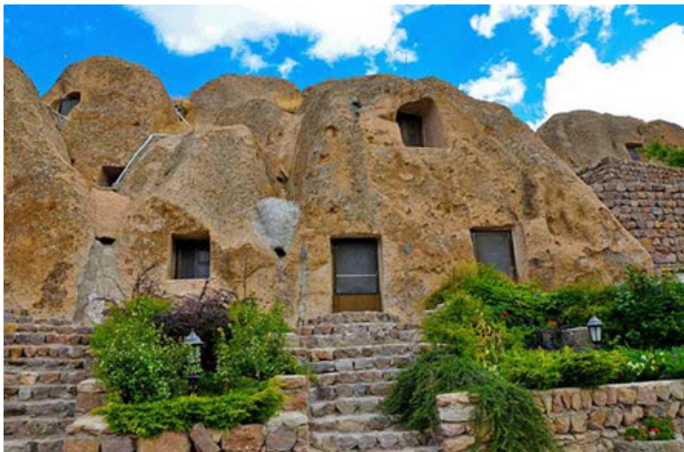
تصویر (۳): زندگی انسان در دل طبیعت

احساس و عواطف، ایجاد ابهام و توهم و مناظر تماشایی طبیعت مورد توجه است. به همین دلیل رمانتیک در پی تحسین طبیعت است برخلاف کلاسیک که به دنبال سلطه بر طبیعت است. فریدریش ویلهلم شیلینگ ۱ که یکی از بنیانگذاران فلسفه رمانتیک محسوب می‌شود معتقد بود که طبیعت جزئی از خود انسان است و بین انسان و طبیعت جدائی نیست. در این سبک معماری هنرمند می‌بایست ترکیبی می‌ساخت که به موازات طبیعت باشد و پروسه حیات و رشد و توسعه را به صورت انتزاعی نشان دهد. رالف والدو امرسون ۲ نویسنده شاعر و کشیش آمریکایی هنرمندان را تشویق می‌کرد که از طبیعت الهام بگیرند. وی هنرمندان را برای یافتن رابطه بین فرم و عملکرد در طبیعت هدایت می‌کرد. به عقیده او طبیعت سیستمی از فرم‌ها و روش‌های به وجود آوردن را خلق می‌کند که مستقیماً قابل تطبیق در هنر است. همچنین ویوله لودوک ۳ معمار معروف فرانسوی معماران را ترغیب می‌کرد که قوانین طبیعی خلقت را به کار گیرند همانند مجسمه سازان قرون وسطی که گیاهان و حیوانات را مطالعه می‌کردند تا بفهمند که چگونه فرم‌های آنها یک عملکردی را نشان می‌دهند و یا خود را با خصوصیات ارگانیسم تطبیق می‌دهند. معماری ارگانیک در آمریکا در قرن ۱۹ توسط فرانک فرنس و لویی سالیوان شکل گرفت. اوج شکوفایی این نظریه را می‌توان در نیمه اول قرن بیستم در نوشتارها و طرح‌های فرانک لویید رایت ۴ مشاهده کرد.