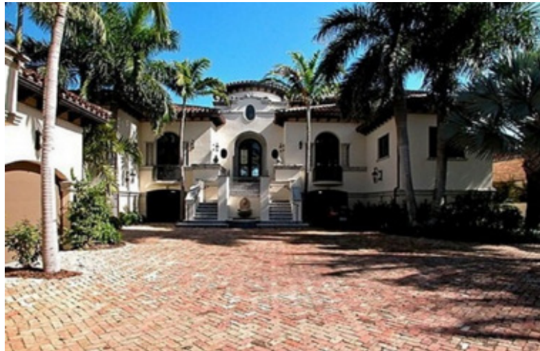
تصویر (۱۹): خانه مارتین اثر فرانک لویید رایت

در سال ۱۹۰۴ میلادی رایت خانه مارتین را در بوفالو در نیویورک بنا کرد. در آنجا نمونه ابتدایی از نوارهای افقی پنجره‌های ساختمان‌های مسکونی‌اش را به کار برد. سپس در سال ۱۹۰۷ میلادی در خانه تومک در ریورساید ایلی نویز ۱ این مورد به عنوان یک عامل فرمال متداوم به کار گرفته شد. در ۱۱ - ۱۹۰۷ میلادی وی خانه کونلی را نیز در ریورساید آبناء کرد. سازه‌ای پیچیده که سقف آن از درون تابع شیب ملایم بام بود. این شیب به وسیله نوارهایی از چوب تیره رنگ که به فضای یک احساس مسدود بودن می‌دهد، بیشتر مورد تأکید قرار می‌گرفت.