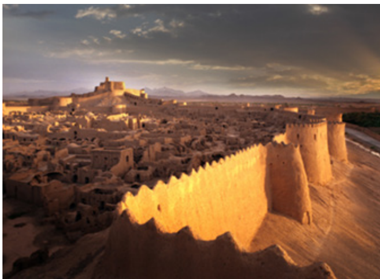
تصویر (۱): ارگ بم

لغت ارگانیک در لغت نامه‌ها به عناوین مختلفی ترجمه شده است که عبارتند از: عالی، بدست آمده از سازوارهای زنده، وابسته به اندام، تن مایه و..... اثر ارگانیک به اثری گفته می‌شود که مانند گیاه و موجودی زنده کاملاً به صورتی پویا در جهت‌های مختلف رشد کرده باشد و هیچ عاملی به جز نیروهای حیاتی مانع رشد آن نشده باشد. نمونه این آثار کلیه پدیده‌ها و موجودات طبیعی مختلف عالم است. انسان به عنوان نماینده خدا در روی زمین با درک اصول پویا و حیاتی عالم طبیعت، خود دست به آفرینش می‌زند، آفرینش ارگانیک که نمونه‌های این نوع شکل‌گیری در تاریخ معماری کشورمان نیز فراوان است، از آن جمله می‌توان به شهرسازی کاملاً ارگانیک و انسانی بافت‌های قدیمی معماری (مانند ارگ تاریخی بم، شکل‌گیری هسته اولیه شهرها و گسترش تدریجی آنها و....) اشاره کرد. شاید بتوان گفت بینش معماری ارگانیک ریشه در فلسفه رمانتیک دارد.