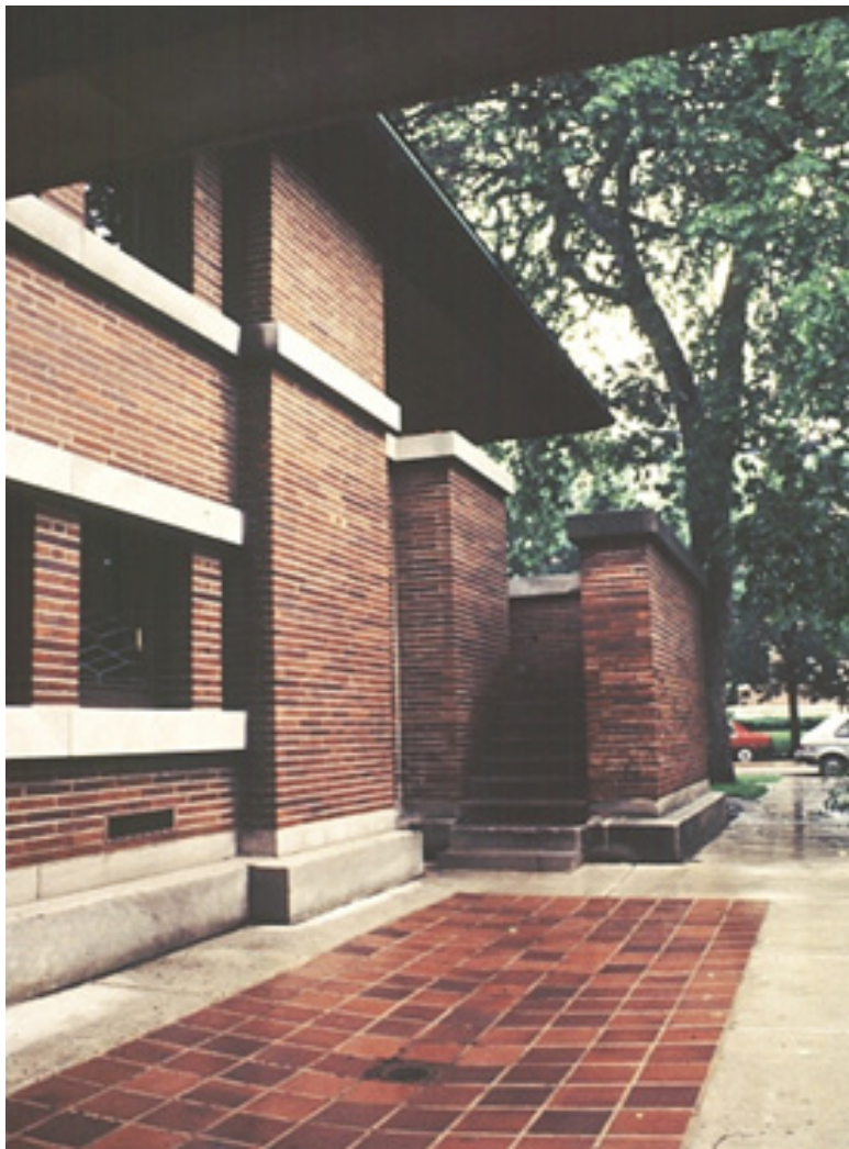
تصویر (۱۱): خانه روبی اثر فرانک لویید رایبیت

پلان مفصل بندی شده آن به تبع خیابان مجاور شکل گرفته است، تأثیرات زیبایی شناختی آن در وهله اول به بازی‌های درونی بین هسته مرکزی که به صورت محوری طراحی شده است همراه با دو پنجره بیرون نشسته قسمت جلو و بال‌های جانبی بنا که تقارن را برهم می‌زنند وابسته است. این عدم تعادل آگاهانه در سطوح مختلف ادامه دارد، به عنوان مثال در بام طبقه بالایی که نسبت به طبقه اصلی حالت عمودی دارد. حاصل کار یک بنای چند وجهی است که در عین حال با بام‌هایی جسورانه به صورت طره پیش‌آمده‌اند و تسلط خطوط افقی به گونه‌ای هماهنگ تداوم دارد.