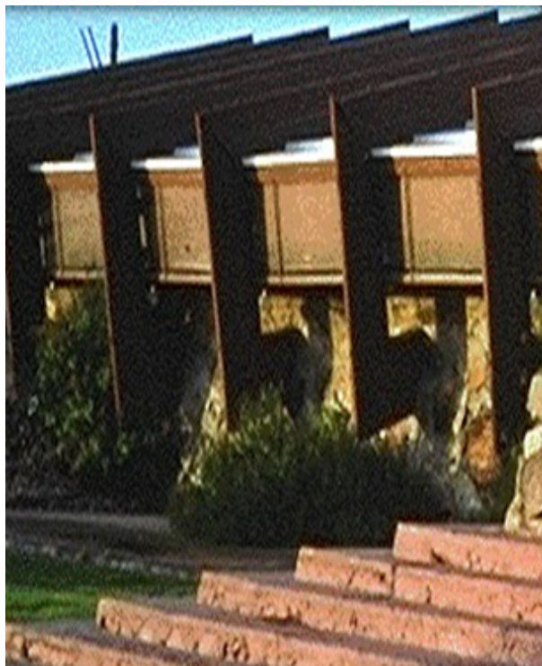
تصویر (۱۴): ساختمان لارکین اثر فرانک لویید راییت

رایت در دوره خانه‌های مرغزاری، ساختمان لارکین در بوفالو را طراحی کرد (۵ - ۱۹۰۴ میلادی). تماس و ارتباط با دنیای خارج و محیط پیرامون که تنها در محیط روستایی مورد آرزوی راییت بود، در شهربرایش مفهومی نداشت. این یک ساختمان اداری بود که در اطراف فضایی مرکزی شکل گرفته بود که از طریق یک سقف شیشه‌ای نور می‌گرفت و با تالارهایی احاطه شده بود. از بیرون تنها یک نمای ناب گرایانه شکوهمند به شکل یک منشور پیدا بود که در چهار گوشه آن برج‌های برجسته یکدست قرار داشتند. این برج‌ها در واقع راه پله‌های ساختمان را در دل خود جای داده بودند و در داخل دیوارهایشان کانال‌های جریان هوا تعبیه شده بود. ساختمان لارکین، نخستین بنای اداری همراه با تهویه مطبوع بود این بنا در سال ۱۹۴۹ میلادی تخریب شد.