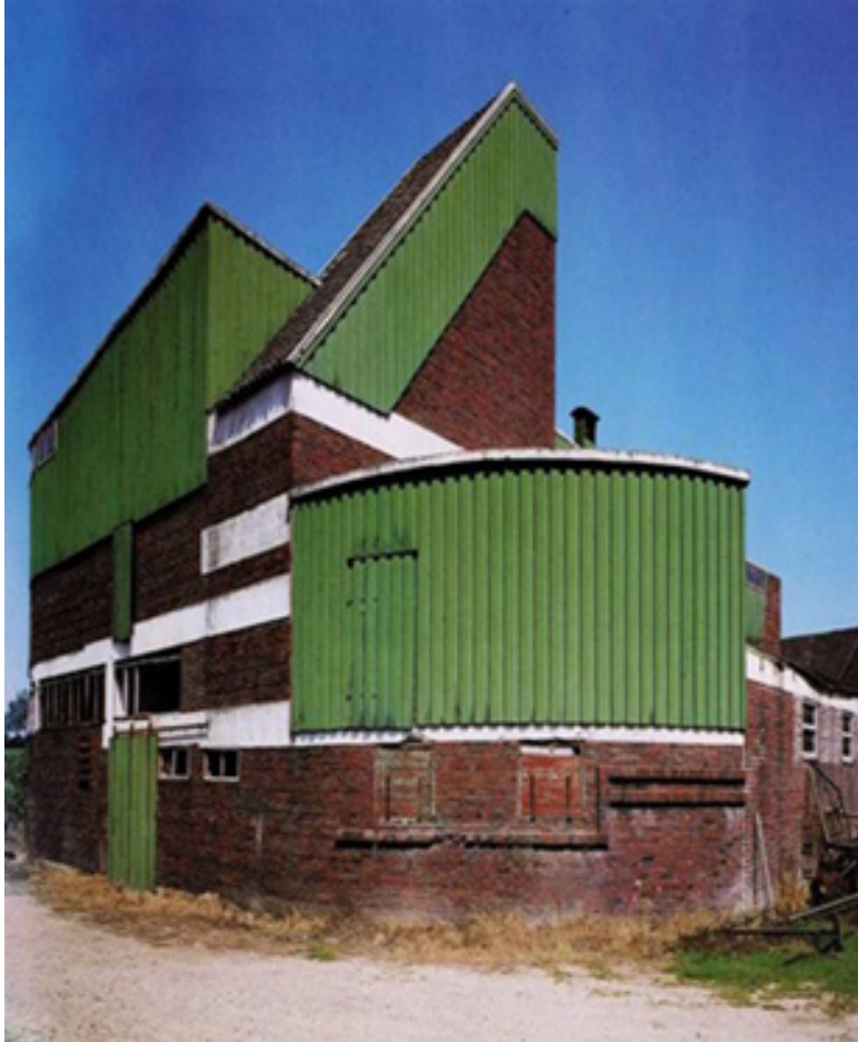
تصویر (۹): توجه به حرکت و پویایی در آثار هوگو هرینگ

به عقیده وی، روش هندسی ساکن و ایستا است و امروزه تمایل بیشتر به سمت ساختارهای انعطاف‌پذیر و در نظر گرفتن ساختمان به عنوان یک ارگانیزم زنده می‌باشد. آنها به سوی کالبدی ارگانیک تمایل دارند و ایده زندگی و حرکت جایگزین انتزاع و سکون می‌شود. شدن به جای بودن. این تغییر جهانی است و همه را شامل می‌شود.