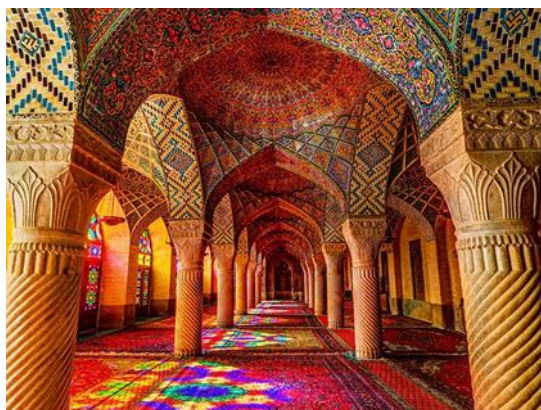
تصویر ۳- کاربرد رنگ در توسعه فضایی مسجد نصیرالملک.

نوع نگرش به رنگ در معماری مسجد نصیرالملک، نگرشی عارفانه به توحید محسوب می‌شود. خداوند نور مطلق است. رهایی از تاریکی و رسیدن به نور الهی و پذیرای رنگ گشتن از طریق ایجاد فضاهای مکث، نور غیر مستقیم، استفاده از رنگ در فضا از جمله نکاتی است که طراح در مسجد برای افزایش حس معنویت به کار می‌گیرد. مسجد از طریق رنگ، غرق در نور خواهد گشت. (بخشوده، ۱۳۹۴: ۹) در معماری ایرانی، همیشه دو الگوی بهره‌گیری از نور، نقوش و رنگ موازی با هم استفاده می‌شده است. در مسجد نصیرالملک برای نخستین بار، این دو الگو در پنجره‌ها بر یکدیگر منطبق شده‌اند و نور که مظهر وحدت در مسجد است با نقش و رنگ که مظهر کثرت است، یکی می‌شود ملاصدرای شیرازی معتقد است با جمع میان کثرت و وحدت و در مورد عین هم دانستن آن‌ها، بسیاری از بیقراری‌های نظری را در حوزه حکمت اسلامی قرار بخشیده است. (زمانپور و همکاران، ۱۳۹۵: ۱۰)