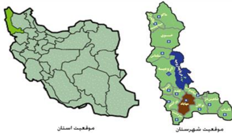
شکل ۳- موقعیت شهرستان مهاباد و استان در کشور (طرح جامع شهر مهاباد، ۱۳۹۵)

مهاباد یکی از شهرهای بزرگ استان آذربایجان غربی می باشد. این شهر در جنوب استان و در دامنه رشته جبال لند شیخان کوهستانی و خوش آب و هوا قرار دارد. مهاباد شهری است که در ساحل شرقی رودخانه مهاباد واقع شده است و امروز به خاطر قرار گرفتن در مرکز تلاقی سه استان آذربایجان شرقی، آذربایجان غربی کردستان از اهمیت خاصی برخوردار است. شهرستان مهاباد یکی از ۱۲ شهرستان تابعه استان آذربایجان غربی است که در محدوده فعلی تقسیمات کشوری خود دارای یک مرکز شهری، ۲ بخش و ۵ دهستان است. مساحت این شهرستان در حدود ۲۷۰ کیلومتر مربع می باشد که تقریباً ۷,۲ درصد کل استان است. شهرستان مهاباد بر اساس آخرین سرشماری در سال ۱۳۹۵ جمعیتی بالغ بر ۲۳۱۰۹۸ نفر در محدوده فعلی تقسیمات کشوری خود دارد که ۶,۳ درصد جمعیت استان آذربایجان غربی است. (طرح جامع شهر مهاباد، ۱۳۹۵).